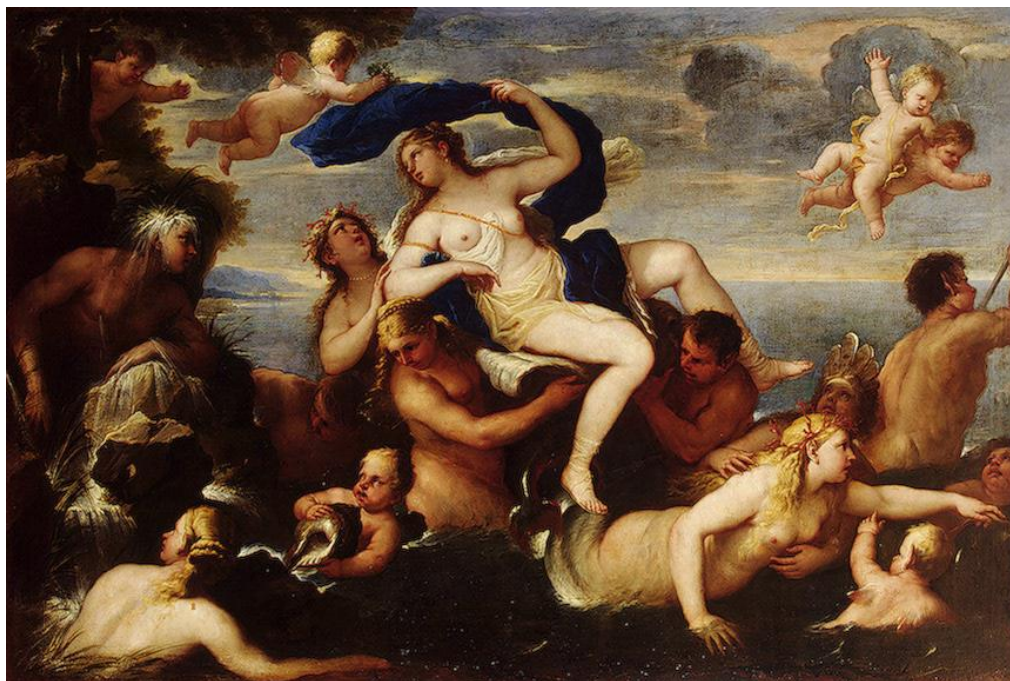
L. Giordano: Triumf Galatey (1675-1677)