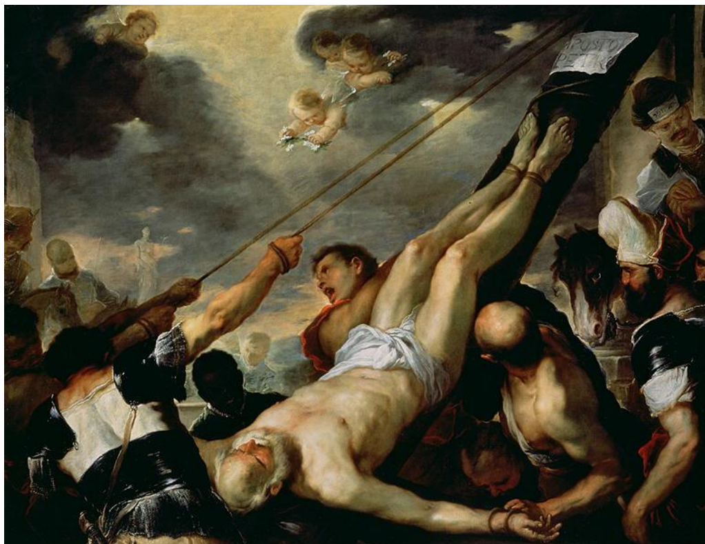
L. Giordano: Ukrižovanie sv. Petra (1660)