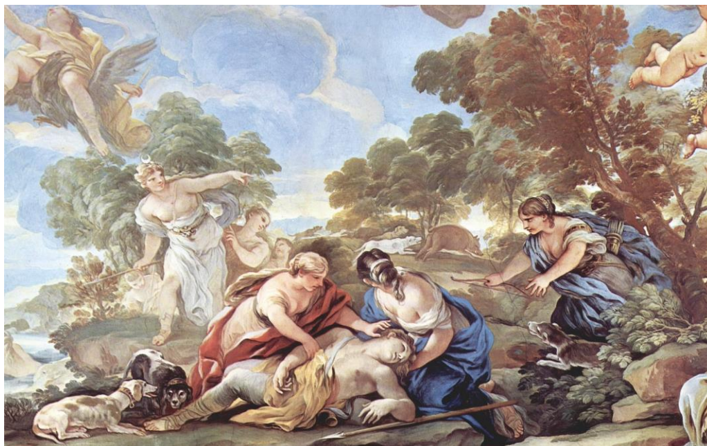
L. Giordano: Smrť Adonisa (freska v Palazzo Medici-Riccardi, 1684-1686)