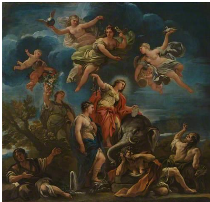
L. Giordano: Alegória Temperancie (17.st.)