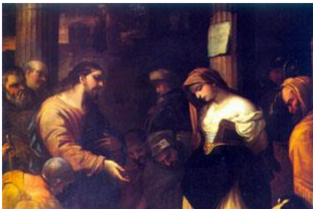
L. Giordano: Kristus a cudzoložnica (1660)