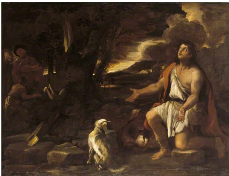
L. Giordano: Podobenstvo o márnotrattnom synovi. Kajúcný pasák sviň (17.st.)