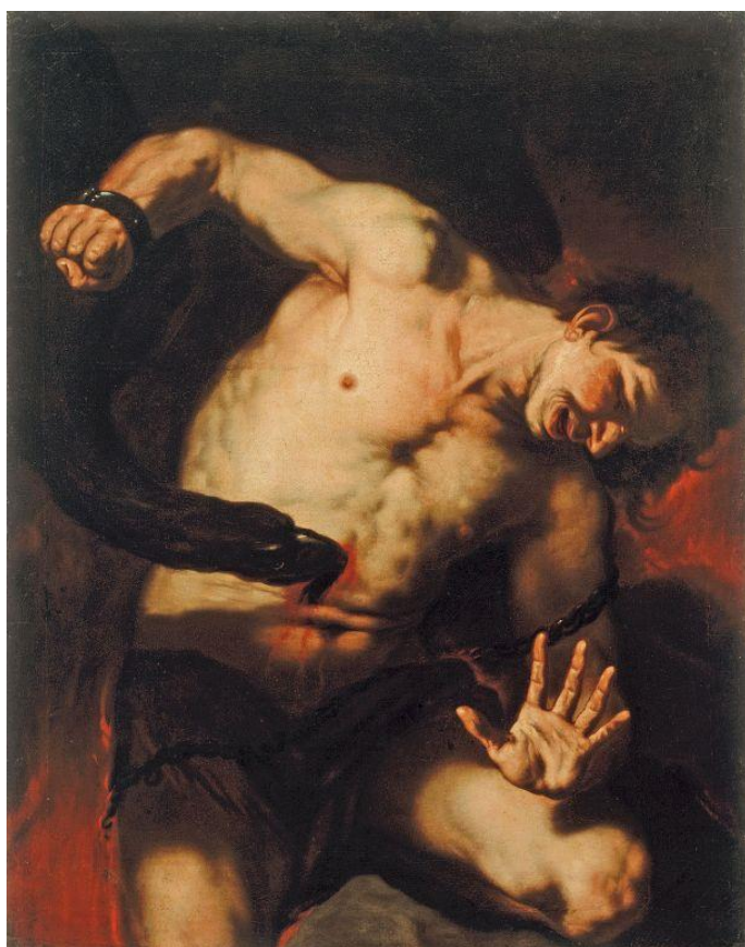
L. Giordano: Prometeus (17.st.)