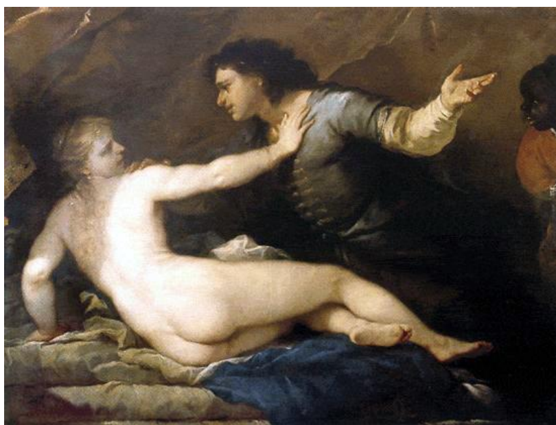
L. Giordano: Znásilnenie Lukrécie (1663)