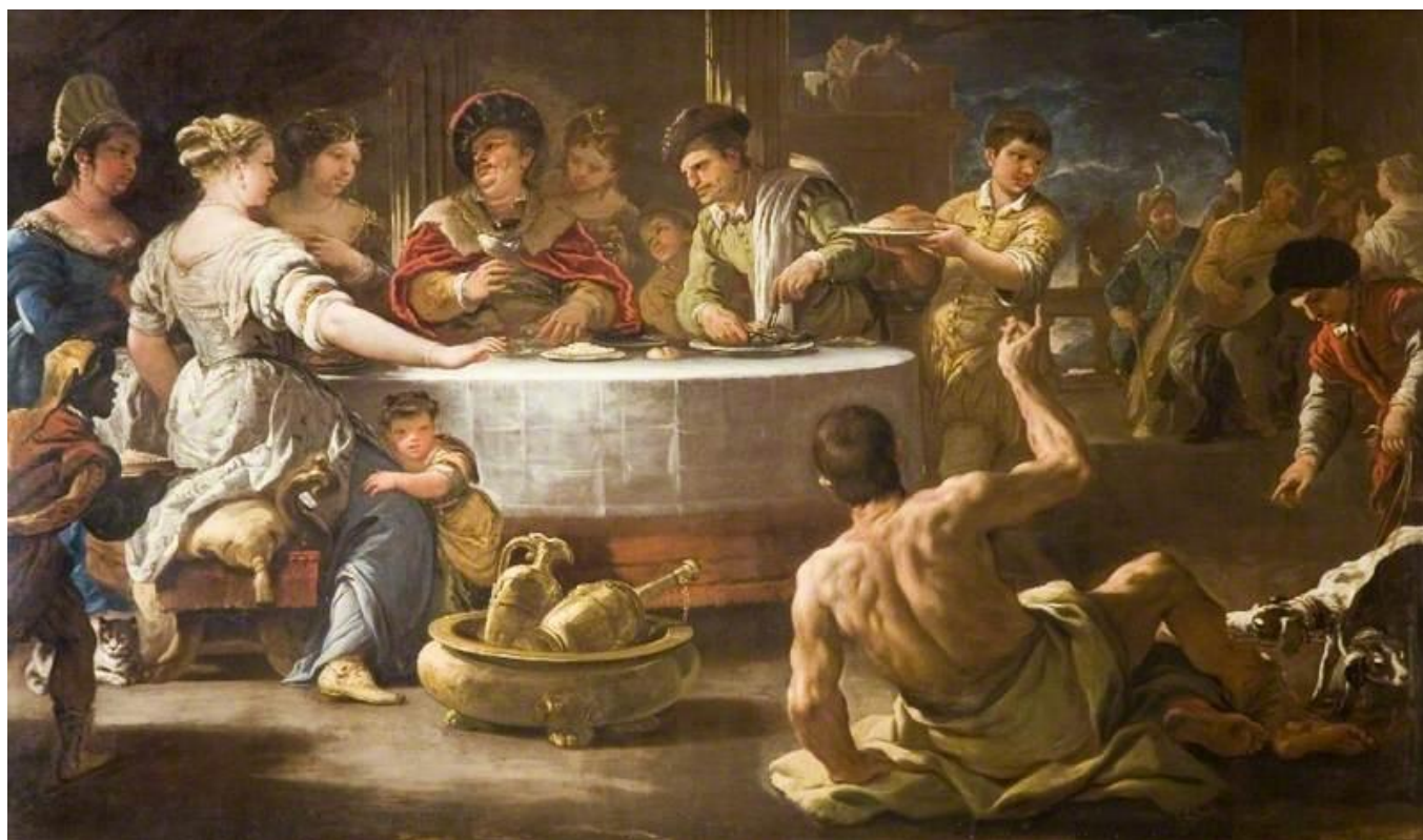
L. Giordano: Boháč a Lazár (17.st.)