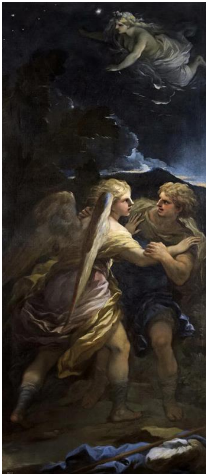
L. Giordano: Jákob bojuje s anjelom (17.st.)