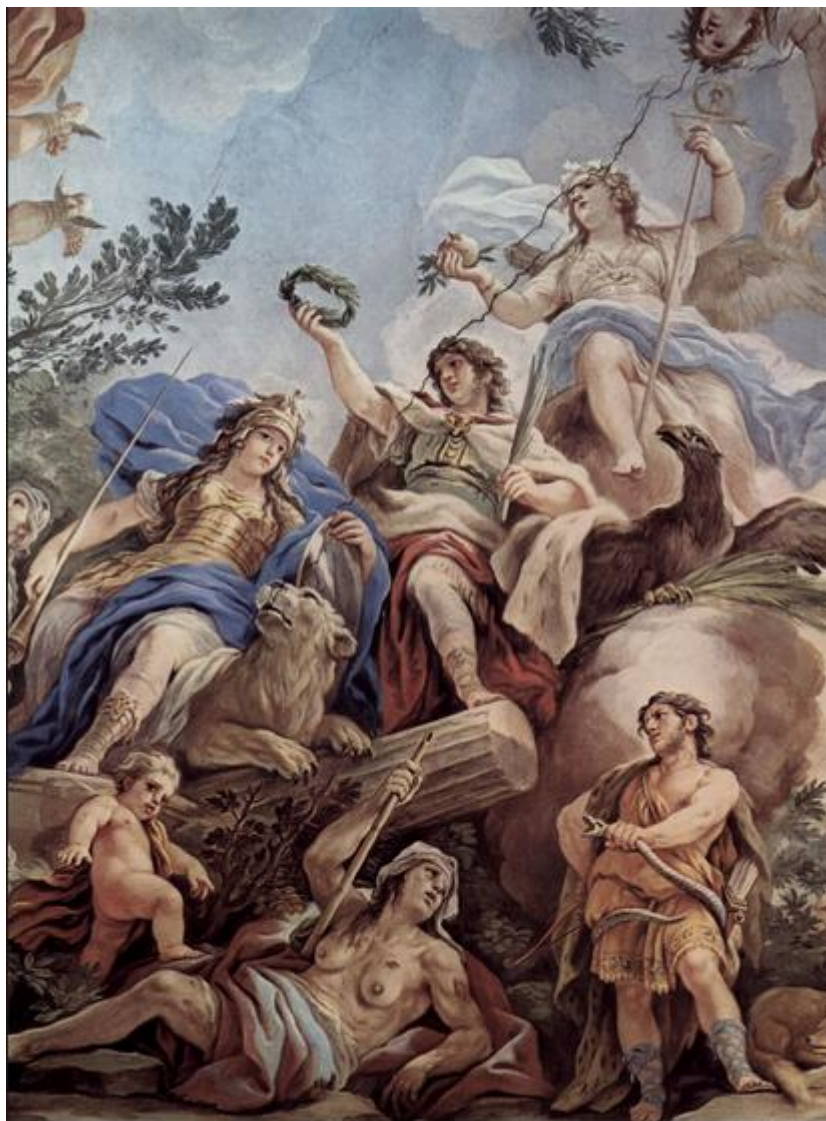
L. Giordano: Korunovanie Fortitudo čestným vencom (freska v Galérii Palazzo Medici-Riccardi, Florencia, 1684-1686)