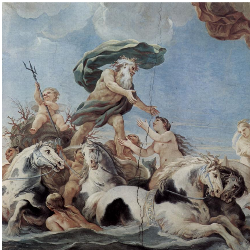
L. Giordano: Triumf Neptúna (freska v Galérii des Palazzo Medici-Riccardi, Florencia, 1684-1686)