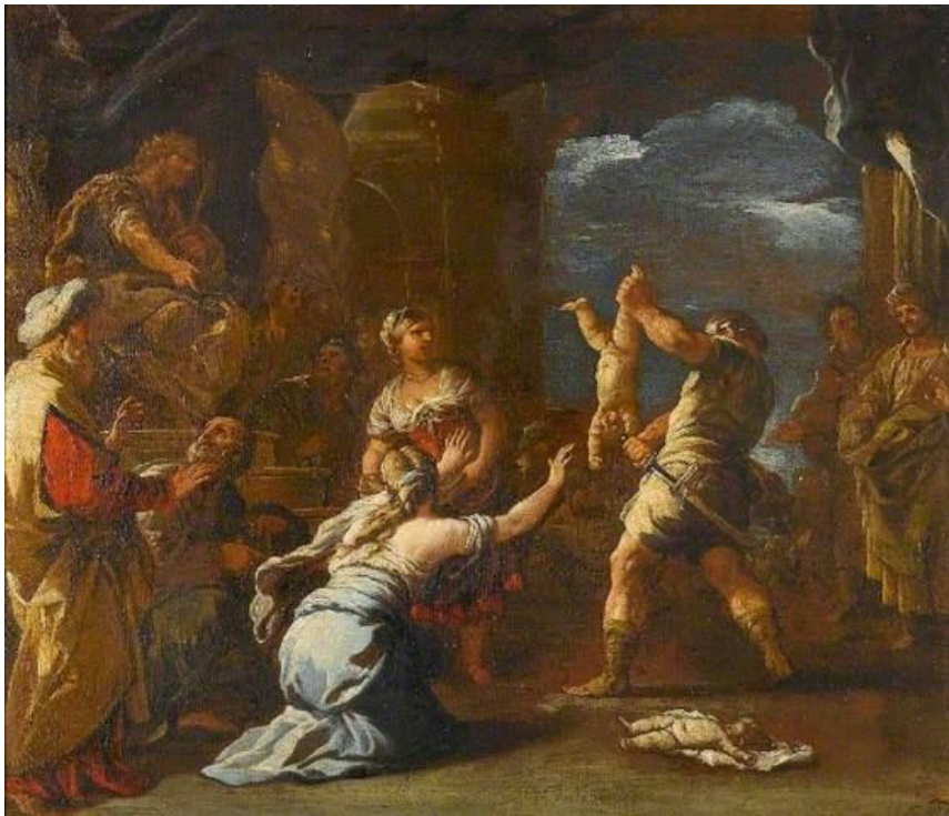
L. Giordano: Šalamúnov súd (17.st.)