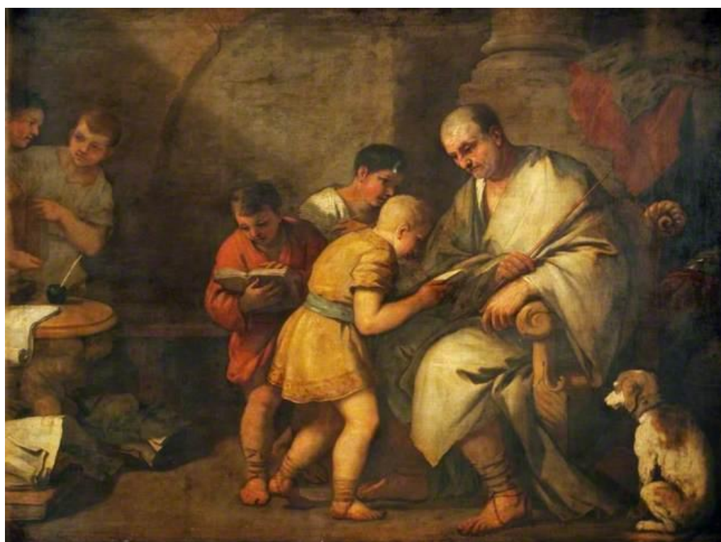
L. Giordano: Aténska škola (17.st.)