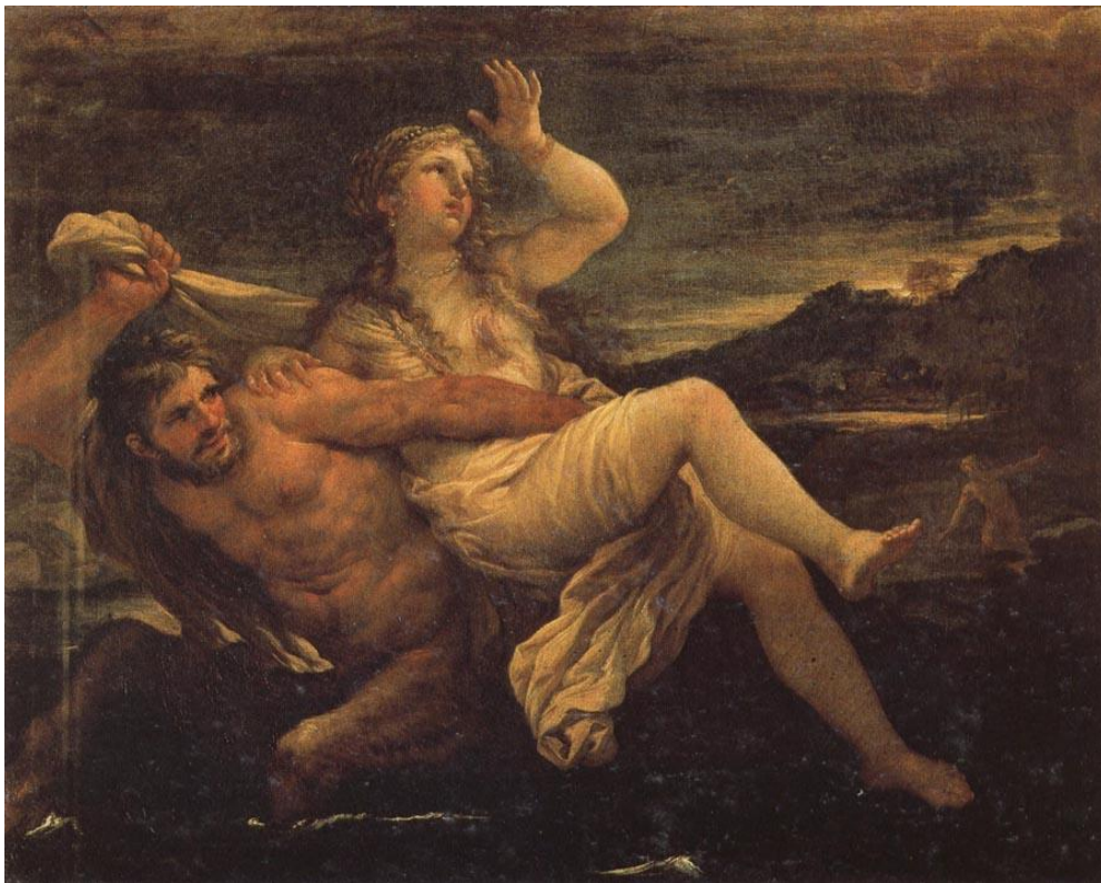
L. Giordano: Únos Deianeiry (17.st.)