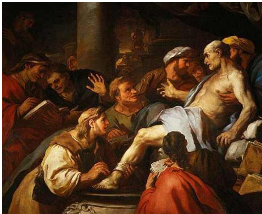
L. Giordano: Smrt' Senecu (1684)