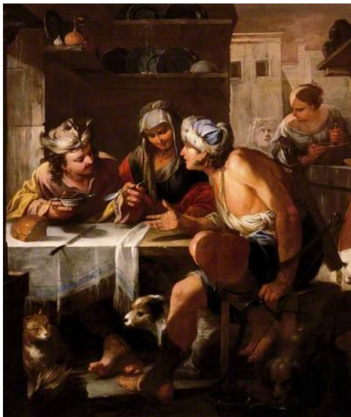
L. Giordano: Ezaus predáva svoje prvorodenstvo (17.st.)