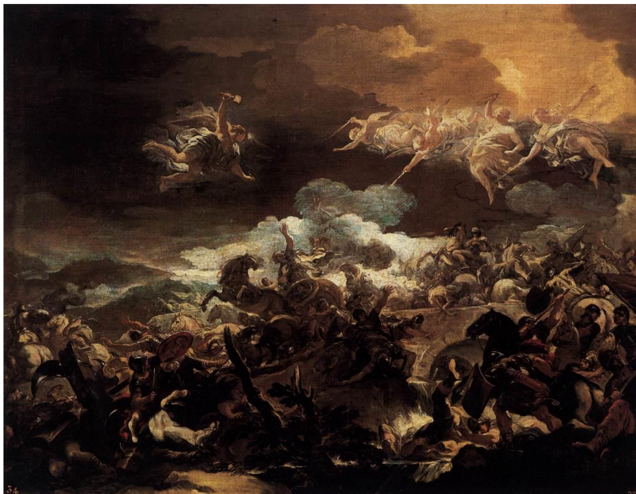
L. Giordano: Porážka Siseru (1692)