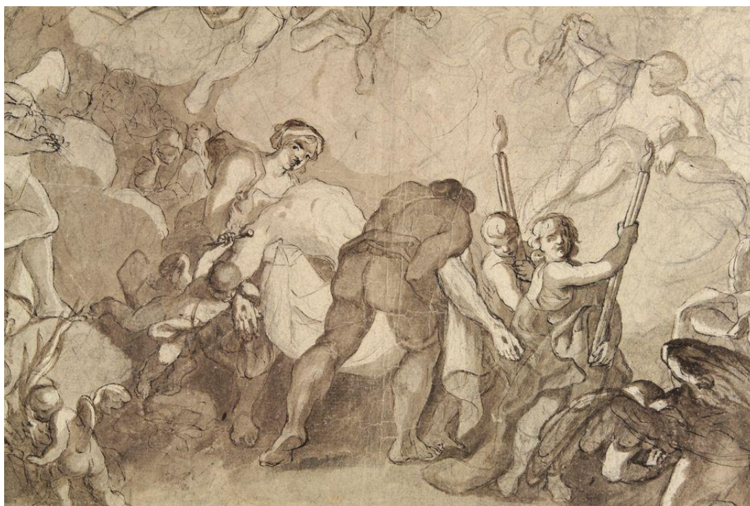
L. Giordano: Prenášanie Kristovho tela (17.st.)