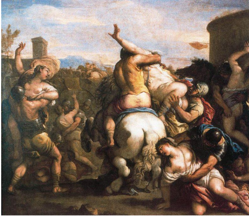
L. Giordano: Únos Sabínok 2 (17.st.)