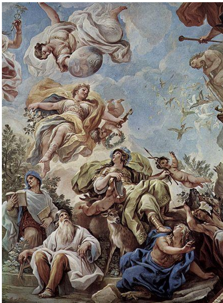
L. Giordano: Alegória Prudencie (freska v Galérii Palazzo Medici-Riccardi, Florencia, 1684-1686)