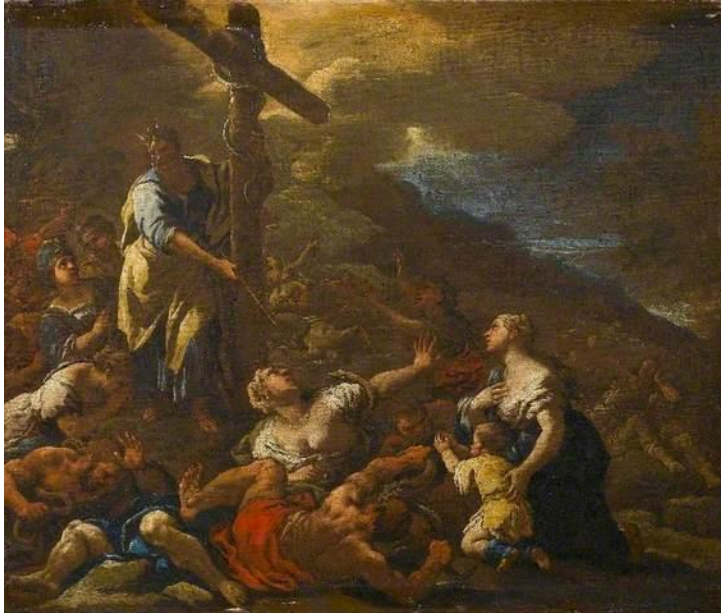
L. Giordano: Mojžiš a bronzový had (17.st.)