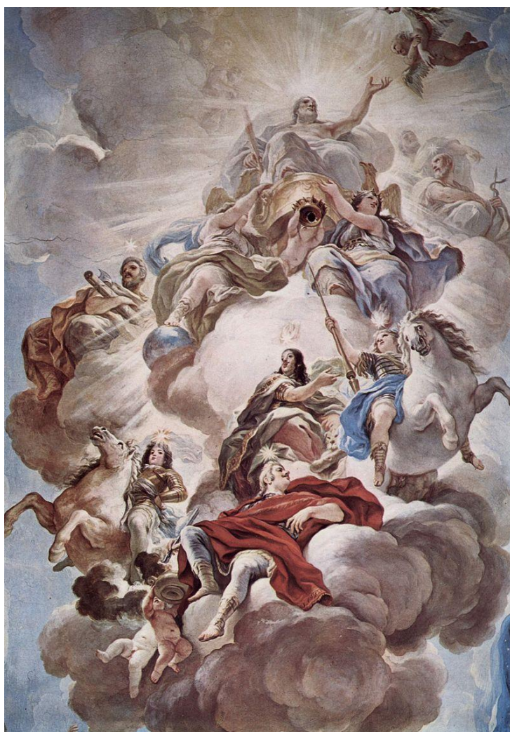
L. Giordano: Tiumf Medicejovcov v oblakoch Olympu (freska v Palazzo Medici Riccardi, Florencia, 1684-1686)