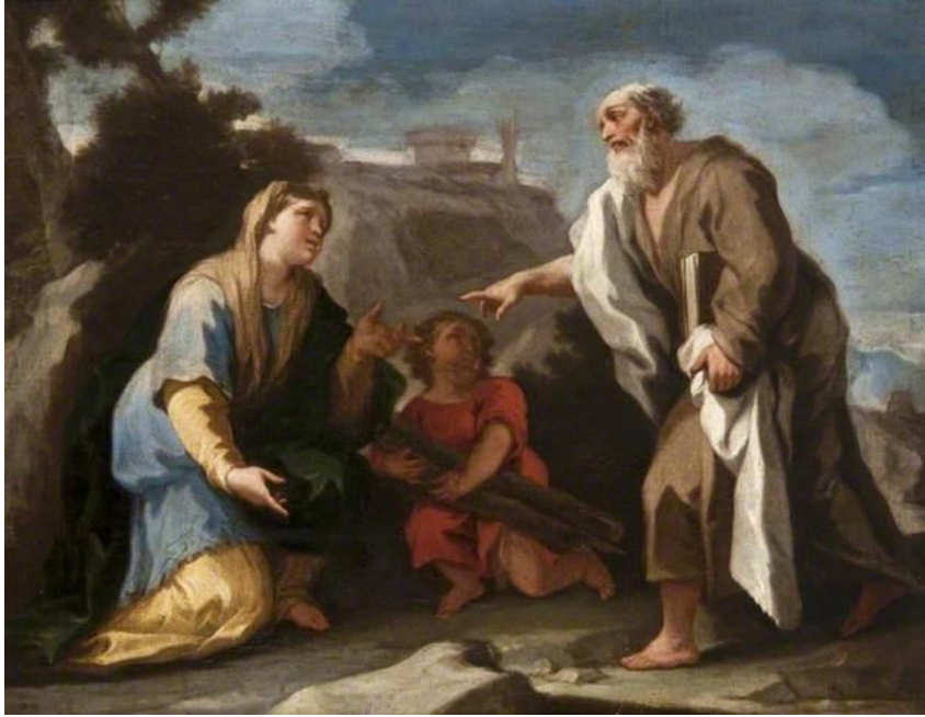
L. Giordano: Eliáš a vdova Sarepta (17.st.)