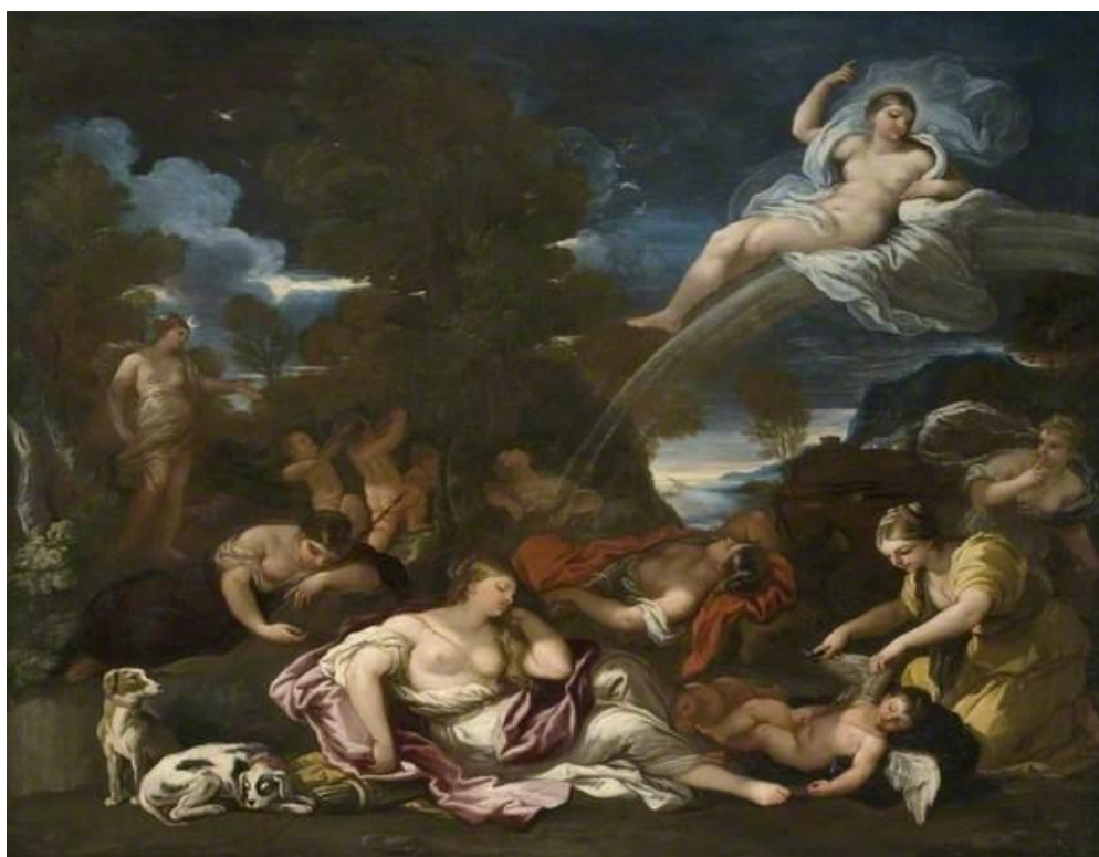
L. Giordano: Odzbrojenie Kupida. Alegória Castitas (17.st.)