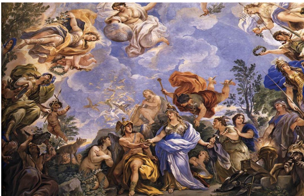
L. Giordano: Muž v stredom veku svojho života (freska v Palazzo Medici-Riccardi, 1684-1686)