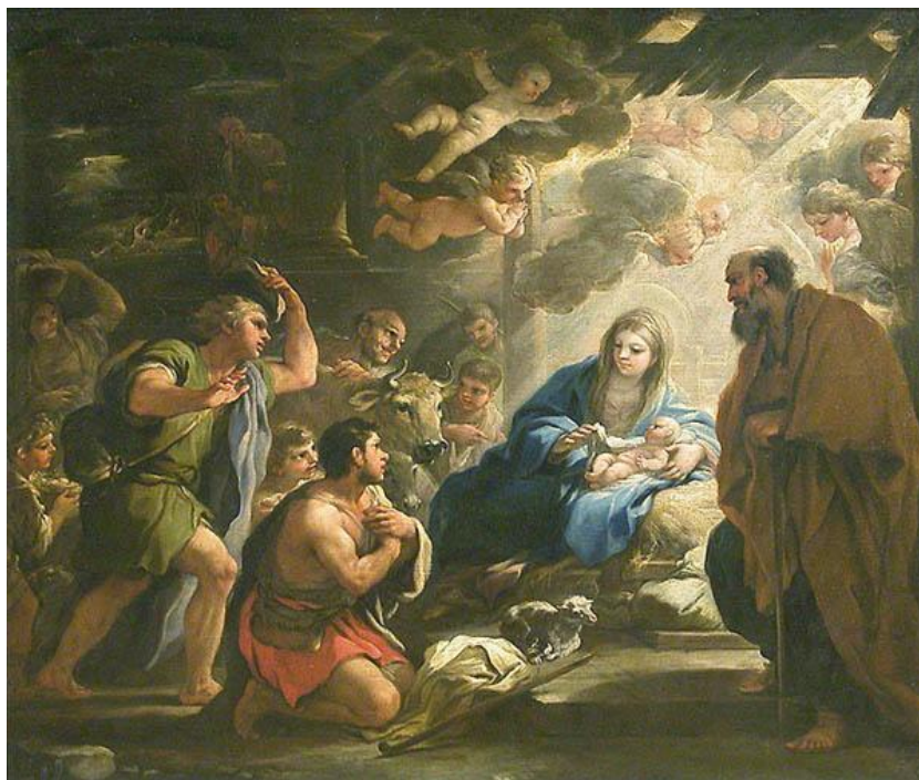
L. Giordano: Klaňanie pastierov (1688)