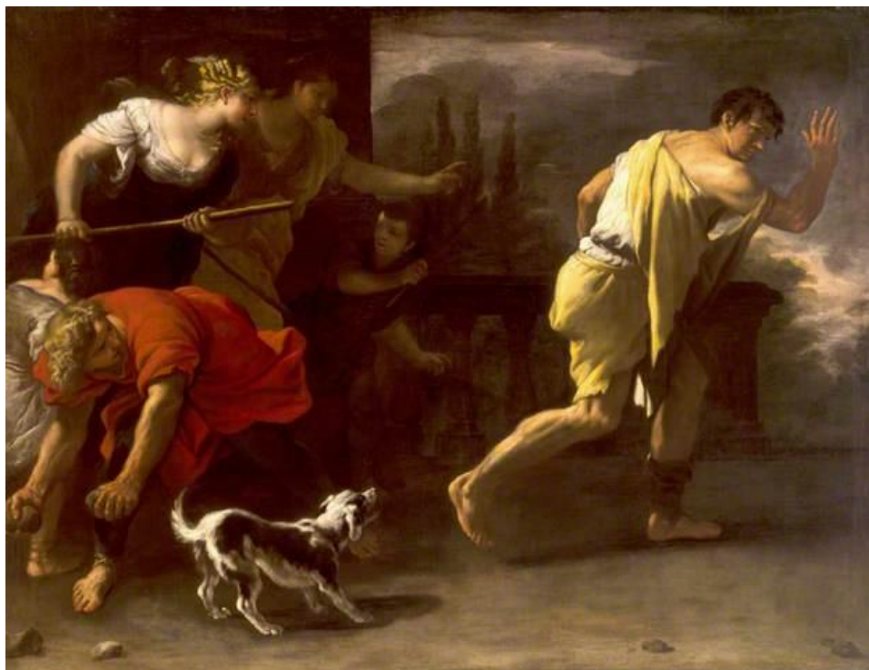
L. Giordano: Podobenstvo o márnotrattnom synovi. Vyhnaný bývalými spoločníckami (17.st.)