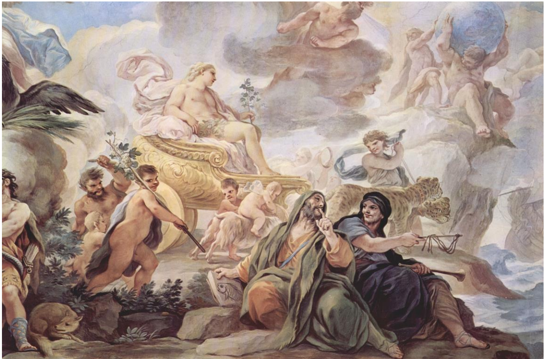
L. Giordano: Bakchus so sprievodom faunov a satyrov (freska v Galérii Palazzo Medici-Riccardi, Florencia, 1684-1686)