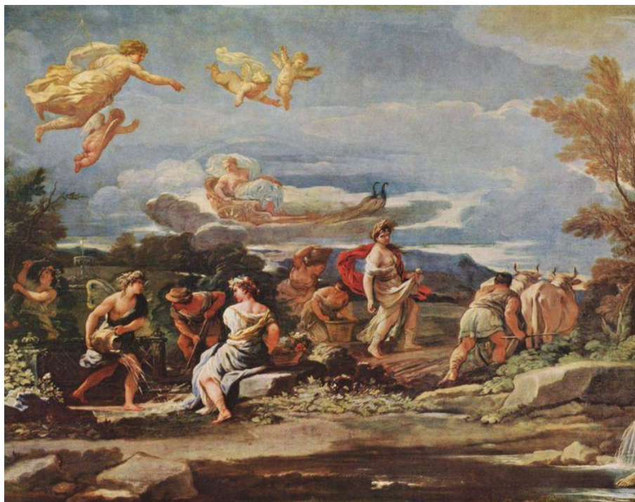
L. Giordano: Vertumnus a Pomona (1682-1683)