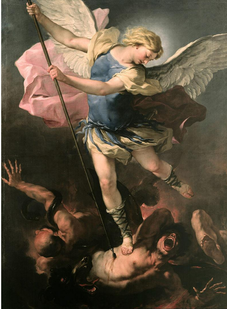
L. Giordano: Sv. Archanjel Michael (1663)