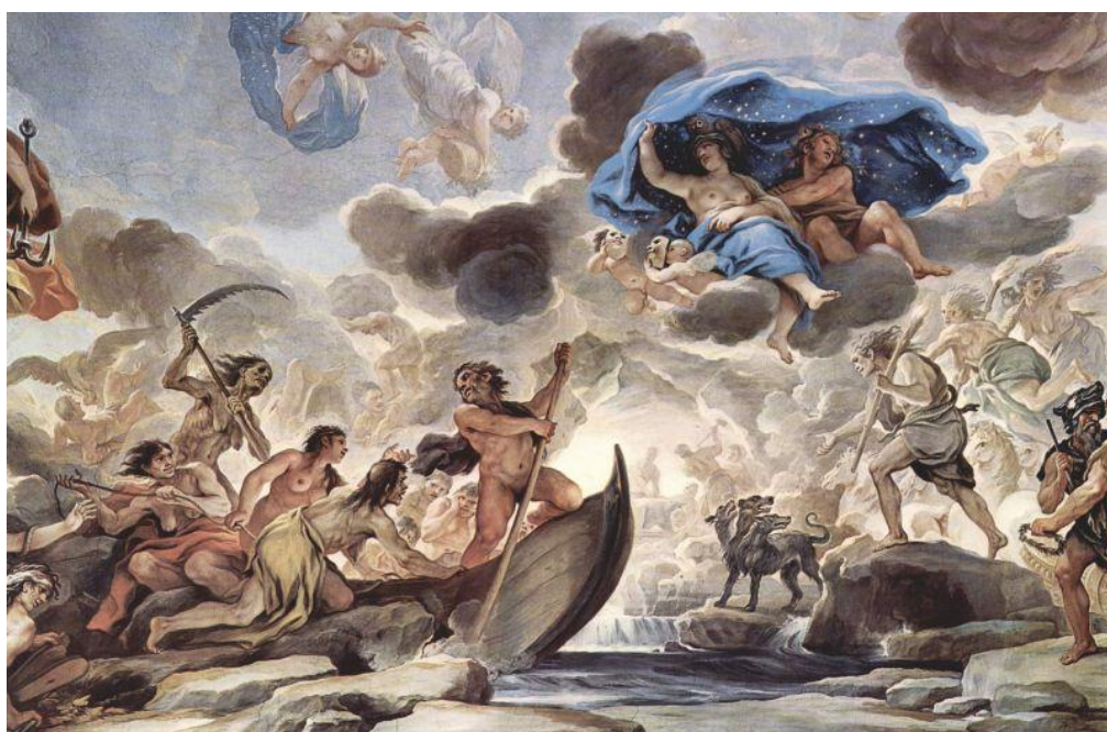
L. Giordano: Cháron a Morfeus a ďalšie podsvetné bytosti (freska v Galerii Palazzo Medici Riccardi vo Florencii, 1684-1686)