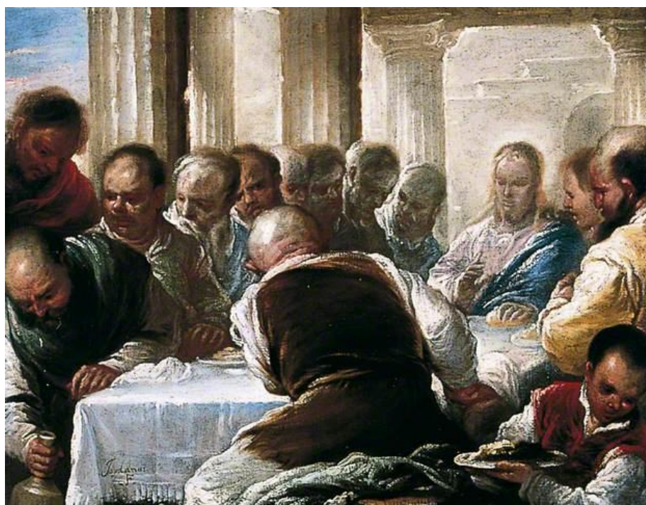
L. Giordano: Posledná večera (detail, 17.st.)