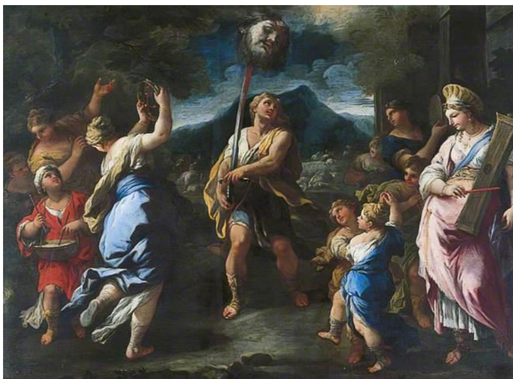
L. Giordano: Triumf Davida (17.st.)