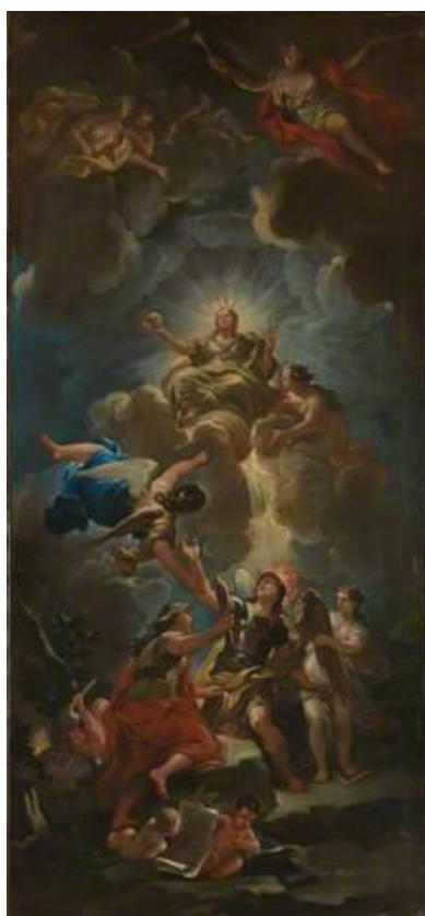
L. Giordano: Alegória Božej múdrosti (17.st.)