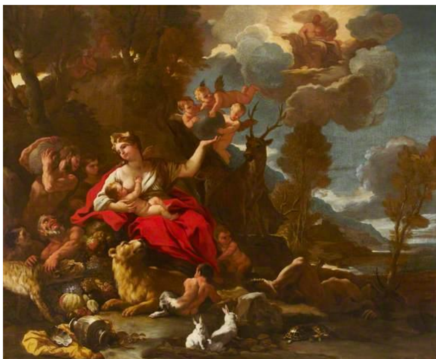
L. Giordano: Kybele (17.st.)