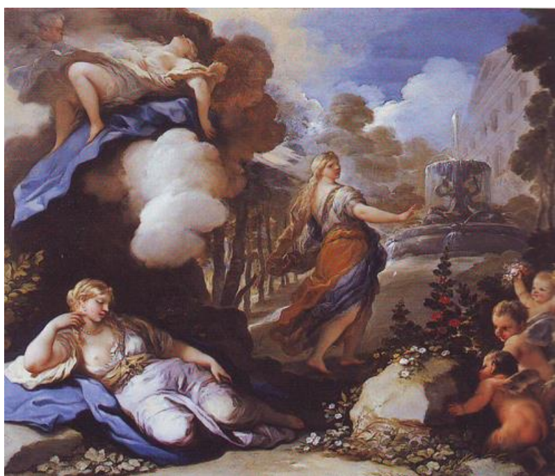
L. Giordano: Psyche prichádza do Kupidovho paláca (17.st.)