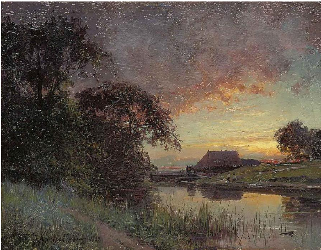
L. Giordano: Súmrak na rieke (187.st.)