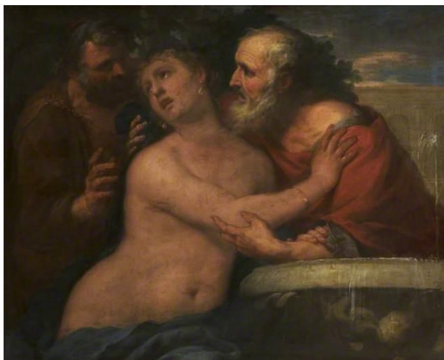
L. Giordano: Zuzana a starší (17.st.)