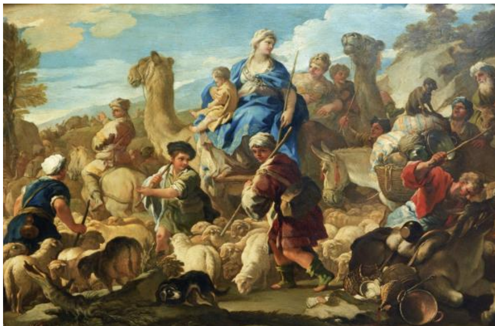
L. Giordano: Odchod Rebeky do Kány (17.st.)