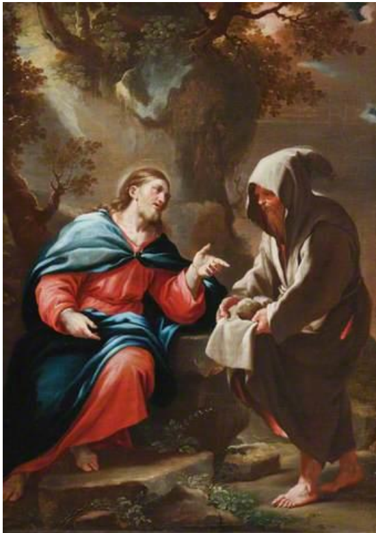
L. Giordano: Diabol pokúša Krista zmeniť kameň na chlieb (17.st.)