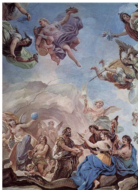
L. Giordano: Stvorenie človeka (freska v Palazzo Medici Riccardi, Florencia, 1684-1686)