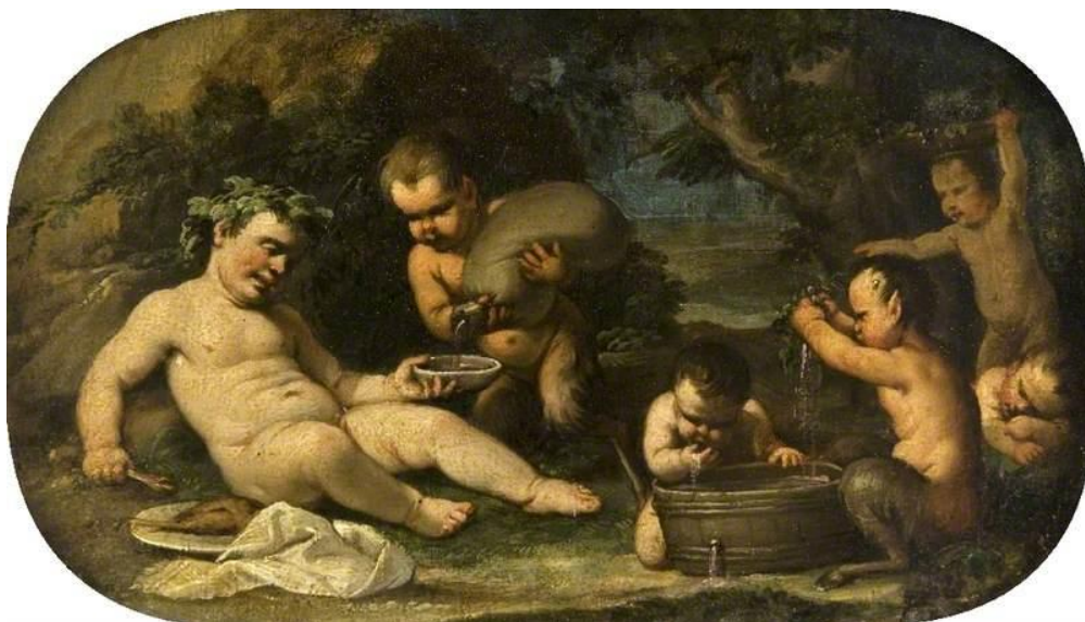
L. Giordano: Bakchus a malí fauni (17.st.)