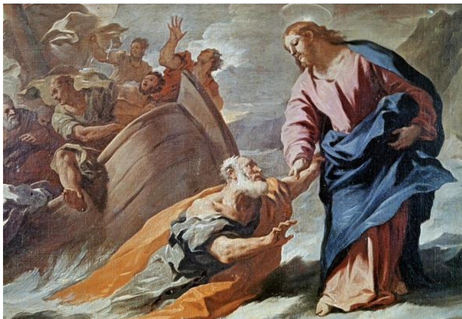
L. Giordano: Ježiš Kristus na mori (17.st.)