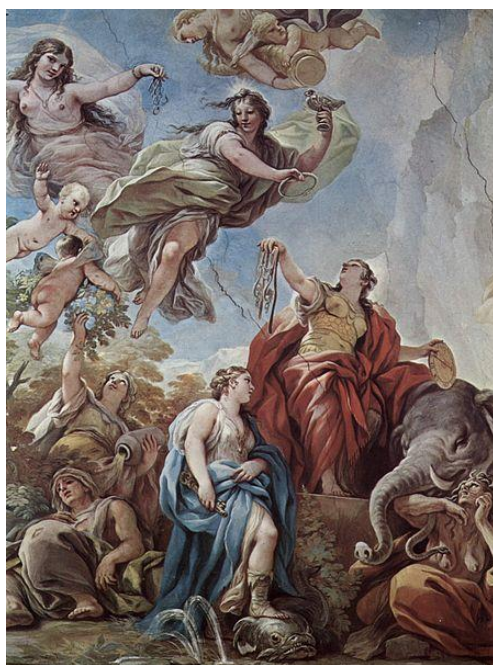
L. Giordano: Temperantia