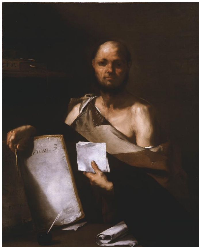
L. Giordano: Filozof (17.st.)