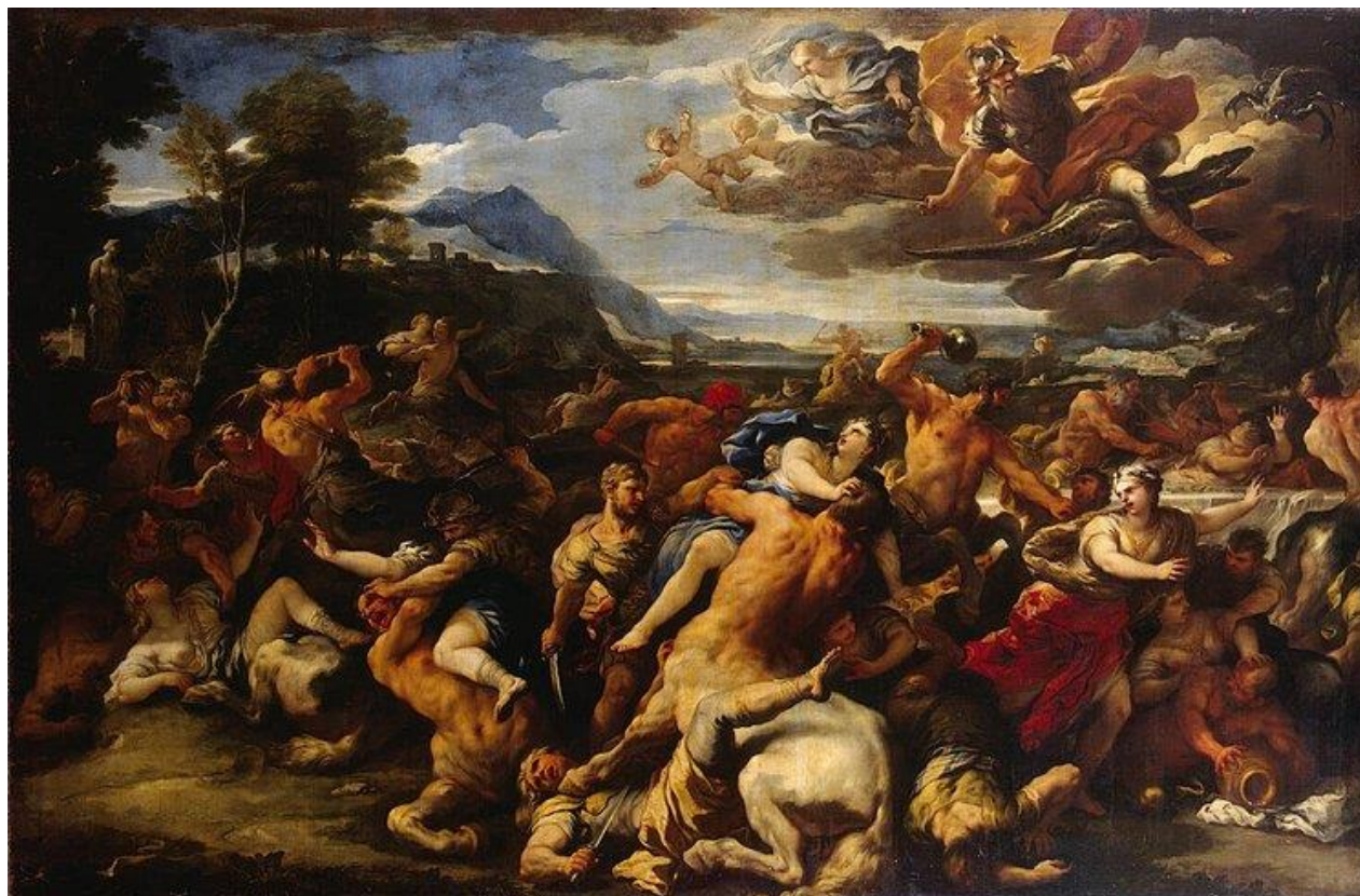
L. Giordano: Bitka medzi Lapitmi a Kentaurami (1688)