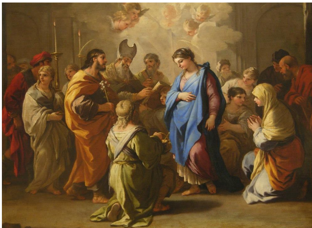
L. Giordano: Svadba Panny Márie (1688)