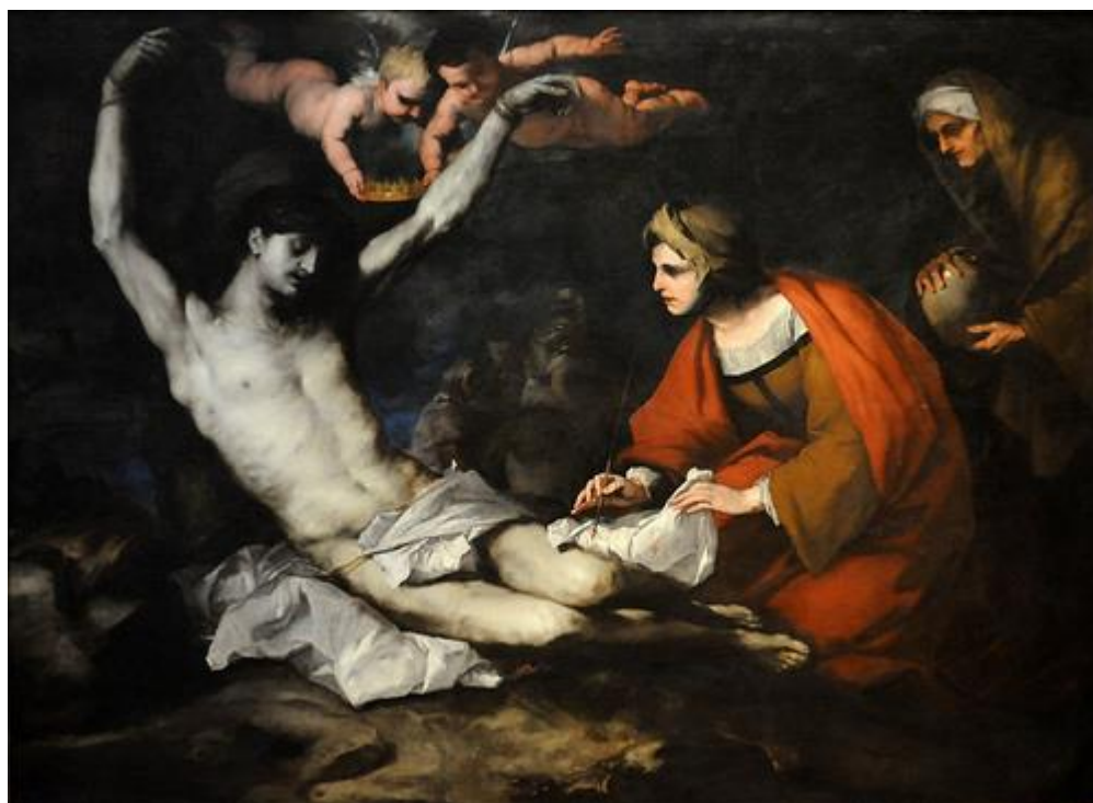
L. Giordano: Šebastián ošetrovaný sv. Irenou (1665)