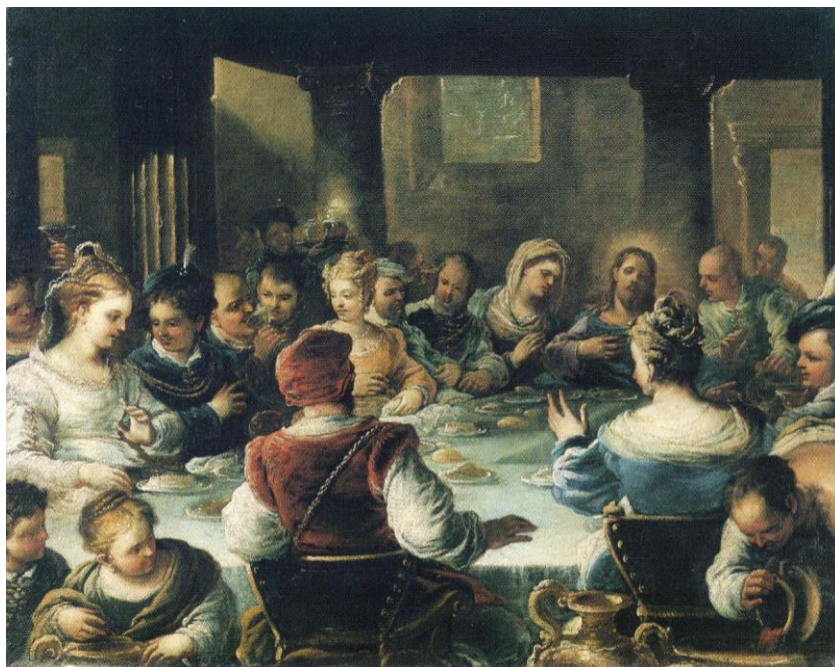
L. Giordano: Svadba v Káne (1663)