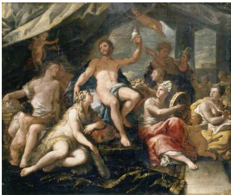
L. Giordano: Hercules a Omfala (17.st.)