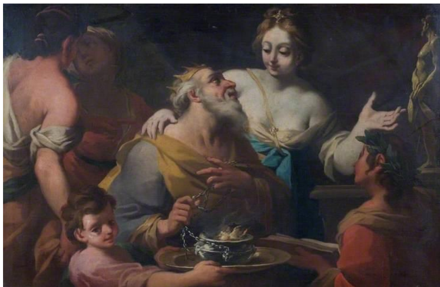
L. Giordano: Kráľ Šalamún obetuje kadidlo modle (17.st.)