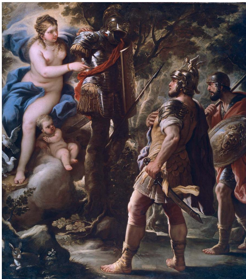
L. Giordano: Venuša žiada o zbrane pre Aenea (1680-1682)