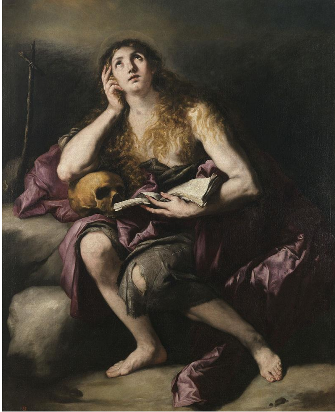
L. Giordano: Mária Magdaléna kajúcnica (1660)