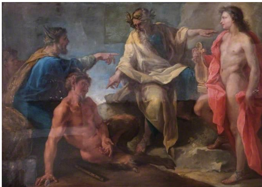
L. Giordano: Súd Midasa (17.st.)