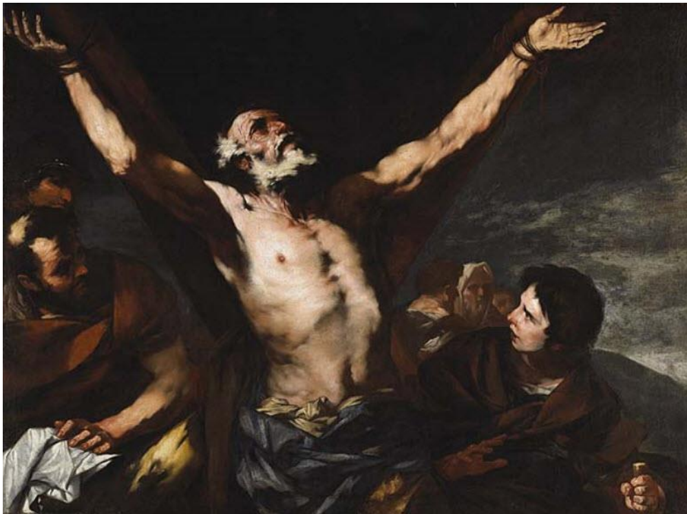
L. Giordano: Ukrižovanie sv. Ondreja (1655)