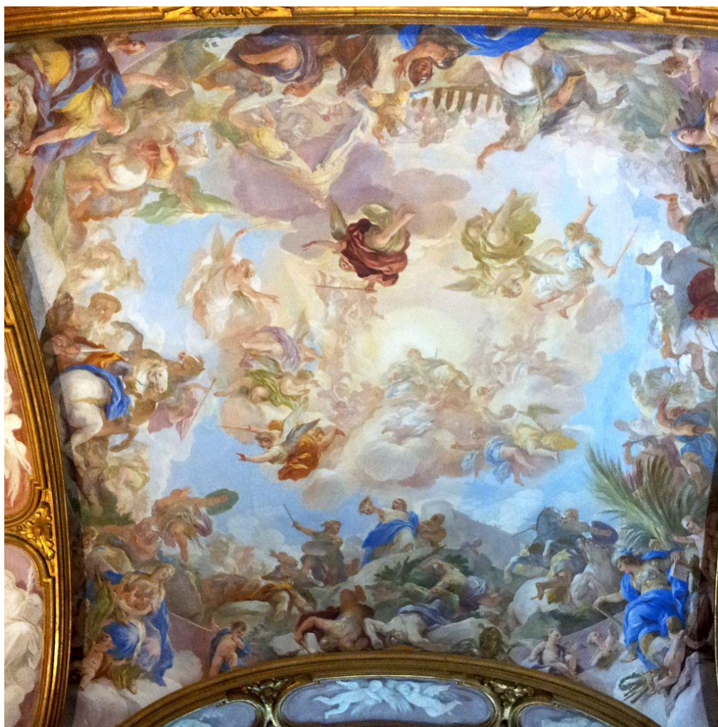
L. Giordano: Triumf Juidity (freska v kláštornom komplexe San Martino v Naples, 1703-1704)