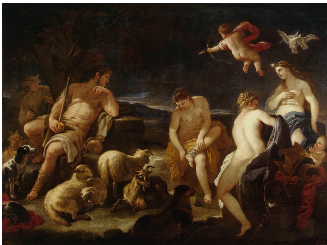
L. Giordano: Paridov súd (1681-1683)