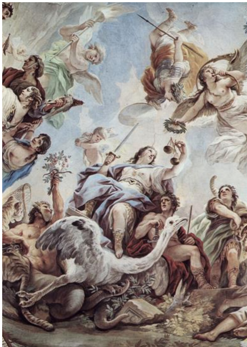
L. Giordano: Korunovanie Justice (freska v Galérii Palazzo Medici-Riccardi, Florencia, 1684-1686)