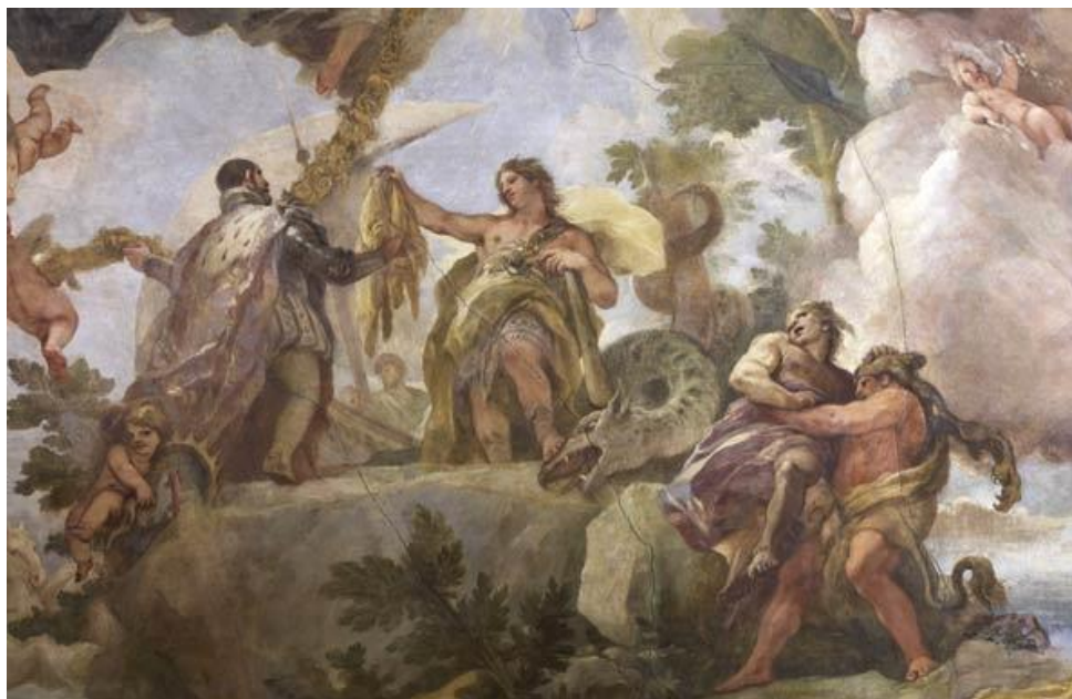
L. Giordano: Založenie Rádu zlatého rúna (fragment fresky, koniec 17.st.)