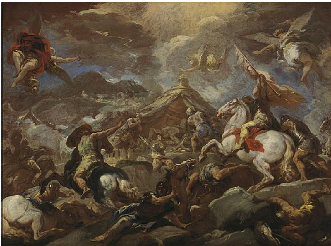
L. Giordano: Objav tela Holofernesa (17.st.)