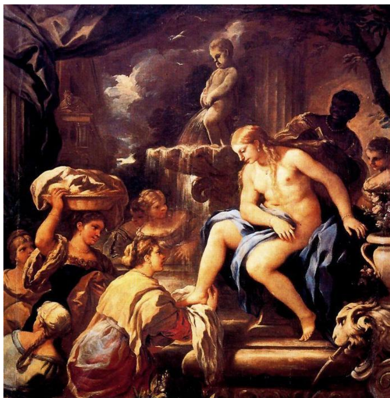
L. Giordano: Betsabe v kúpeli (17.st.)