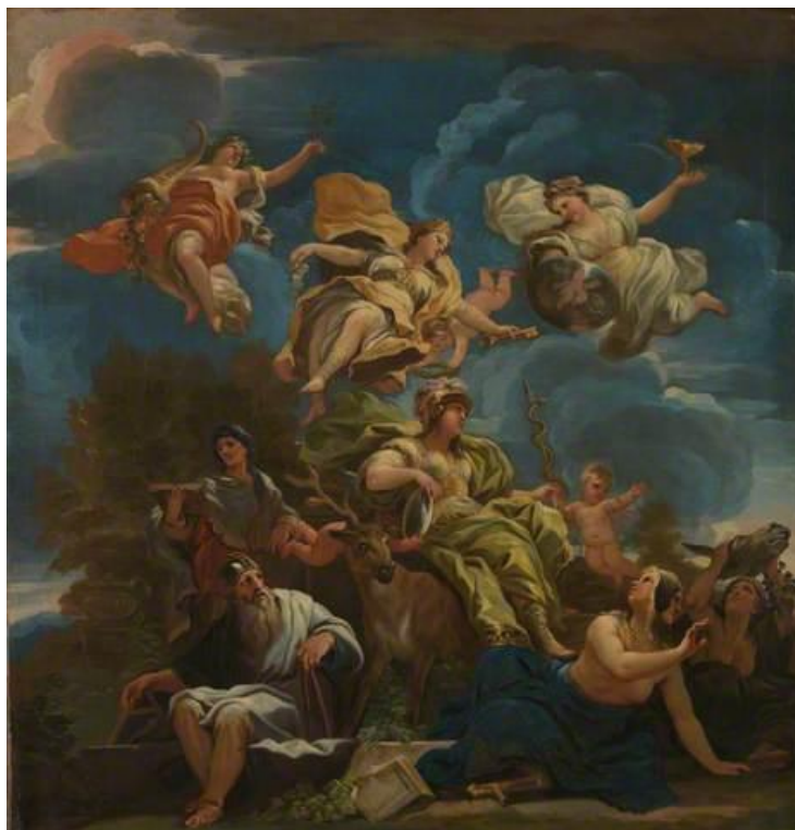
L. Giordano: Alegória Prudencie (17.st.)