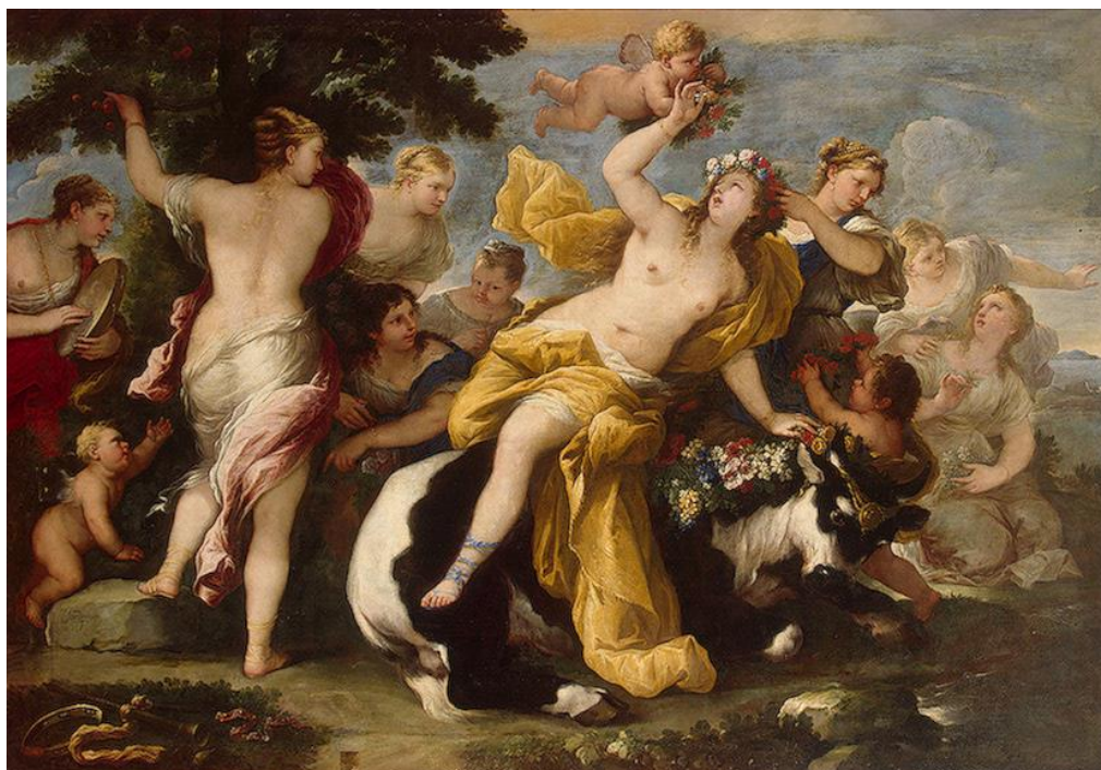
L. Giordano: Únos Európy (1675-1677)