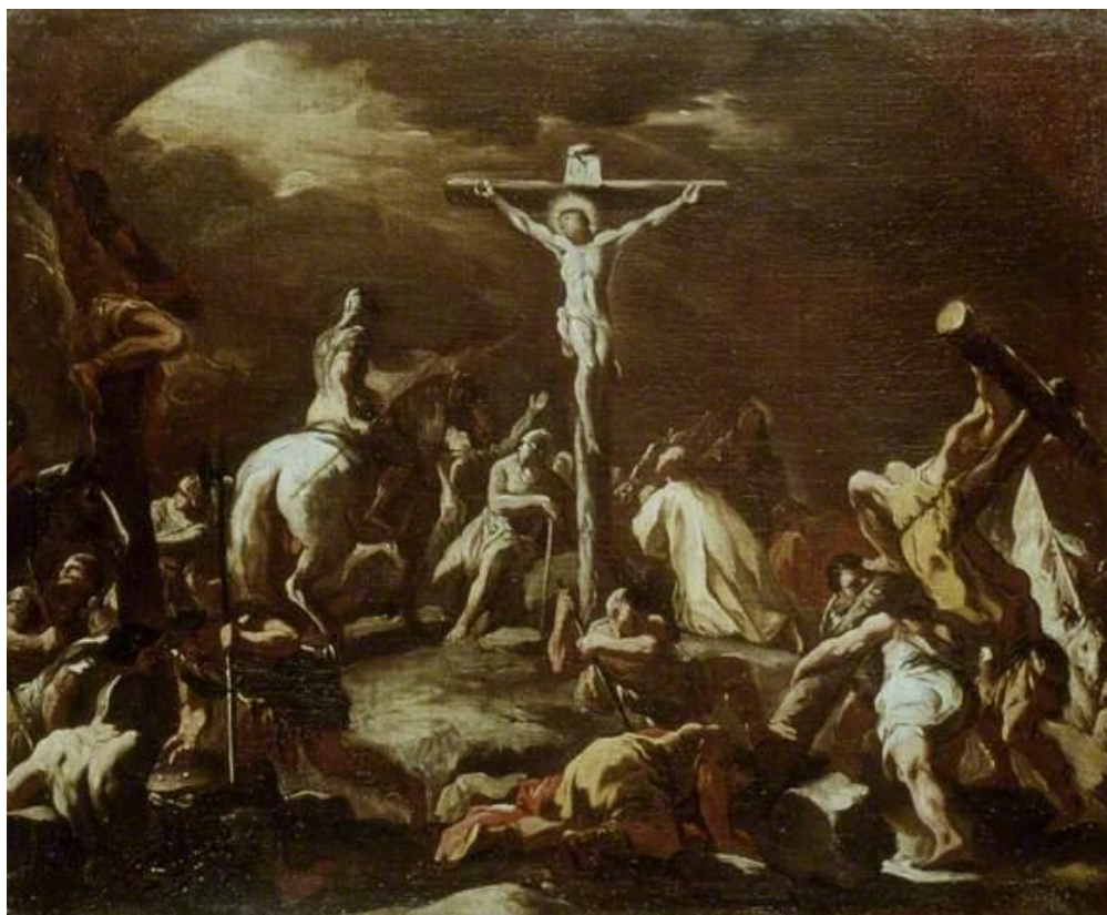
L. Giordano: Ukrižovanie (17.st.)