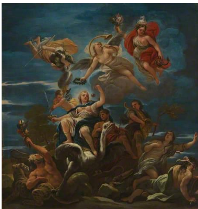
L. Giordano: Alegória Justície (17.st.)