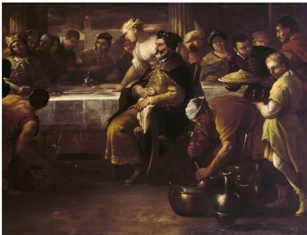
L. Giordano: Podobenstvo o márnotrattnom synovi. Tučné teľa (17.st.)