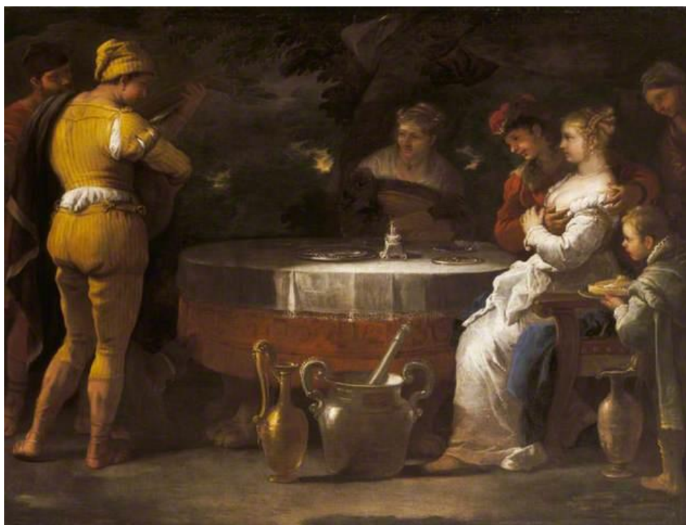
L. Giordano: Podobenstvo o márnoratnom synovi. Hýrenie (17.st.)