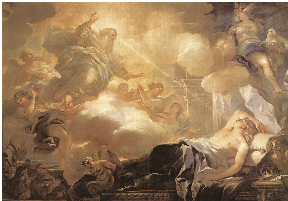
L. Giordano: Sen Šalamúna (1693)