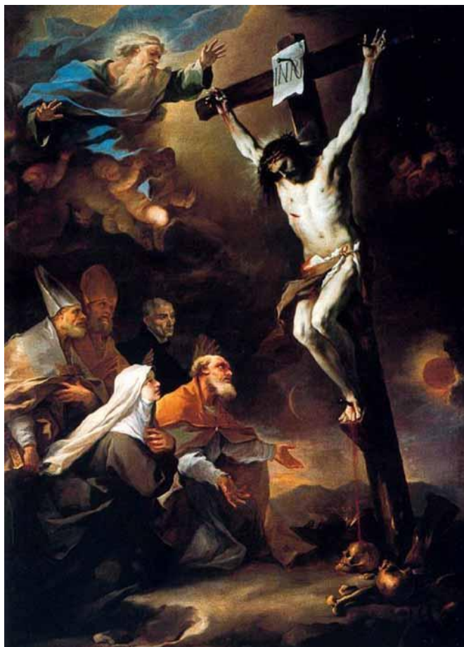
L. Giordano: Patróni Neapola uctievajú Ukrižovaného (1660-1661)