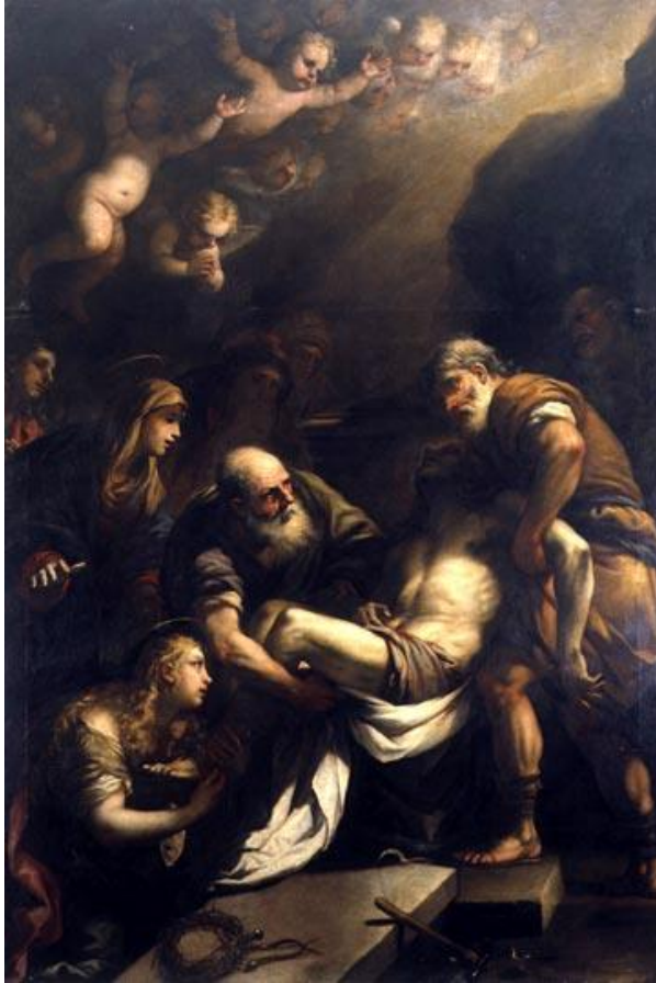
L. Giordano: Ukladanie Krista do hrobu (1671)