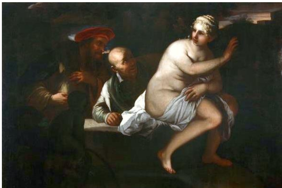
L. Giordano: Zuzana a starci (1670)