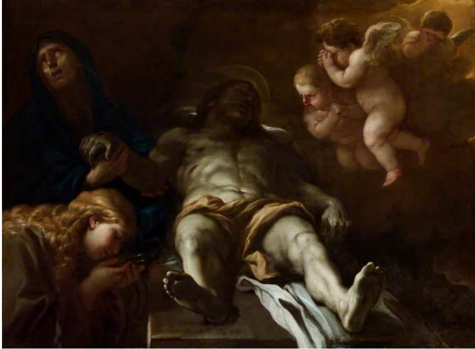
L. Giordano: Oplakávanie (17.st.)