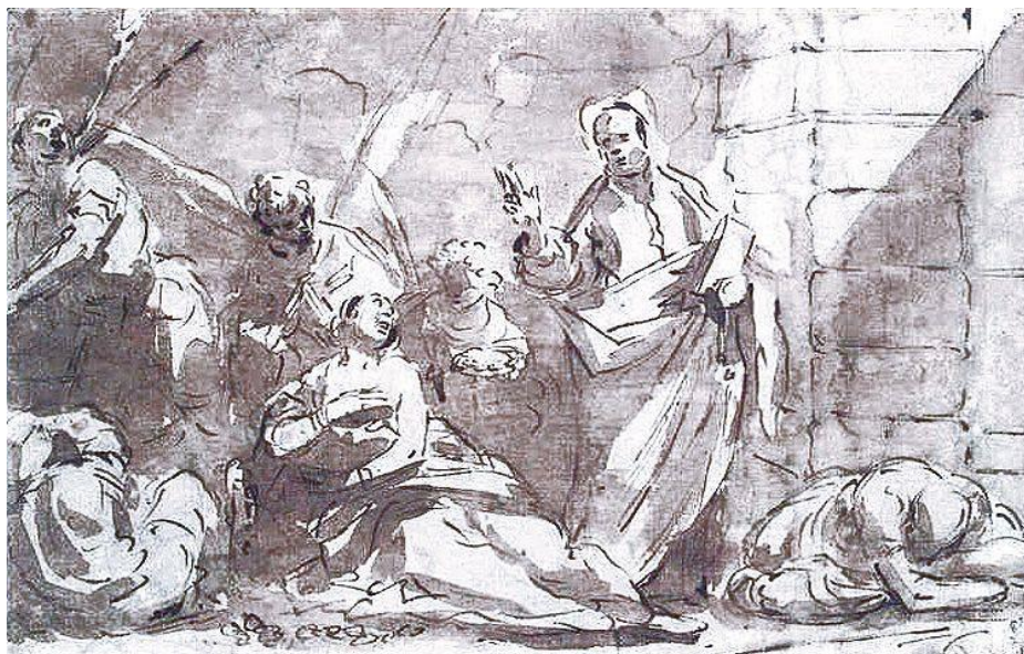
L. Giordano: Sv. Peter so sv. Agátou vo väzení (17.-18.st.)