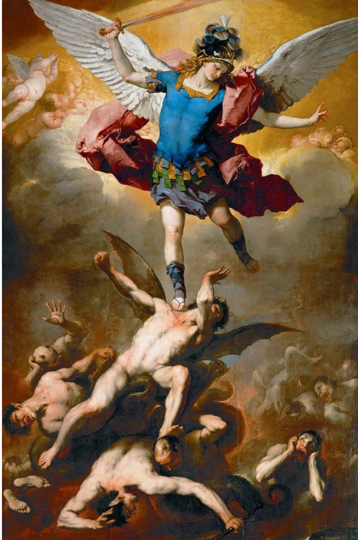
L. Giordano: Sv. Archanjel Michael a padlí anjeli (1666)