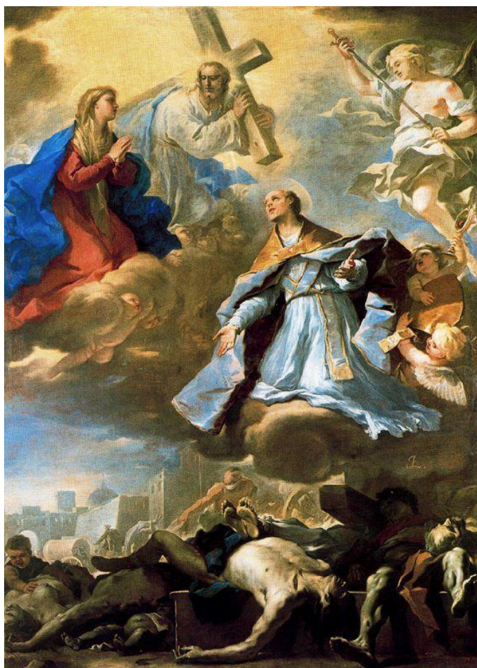
L. Giordano: Sv. Gennaro prosí s Pannou Máriou Krista a Boha Otca o ochranu pred morom (1656)