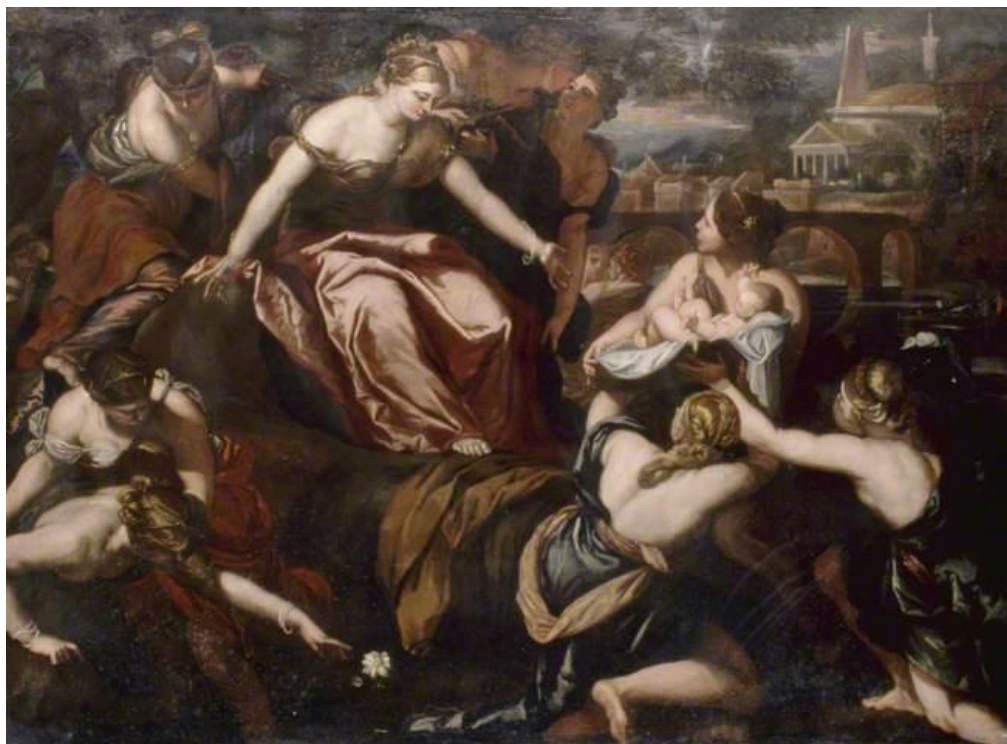
L. Giordano: Vylovenie Mojžiša (17.st.)