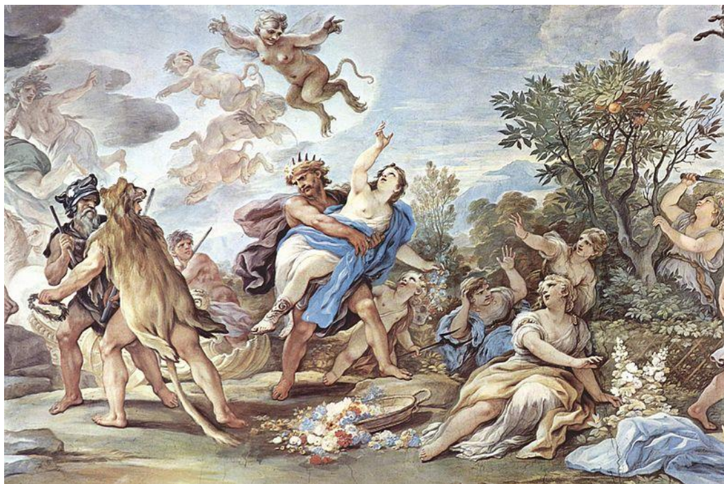
L. Giordano: Únos Proserpiny (freska v Palazzo Medici Riccardi, Florencia, 1684-1686)