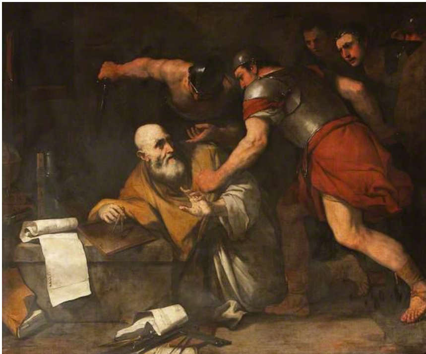
L. Giordano: Smrť Archimeda (17.st.)