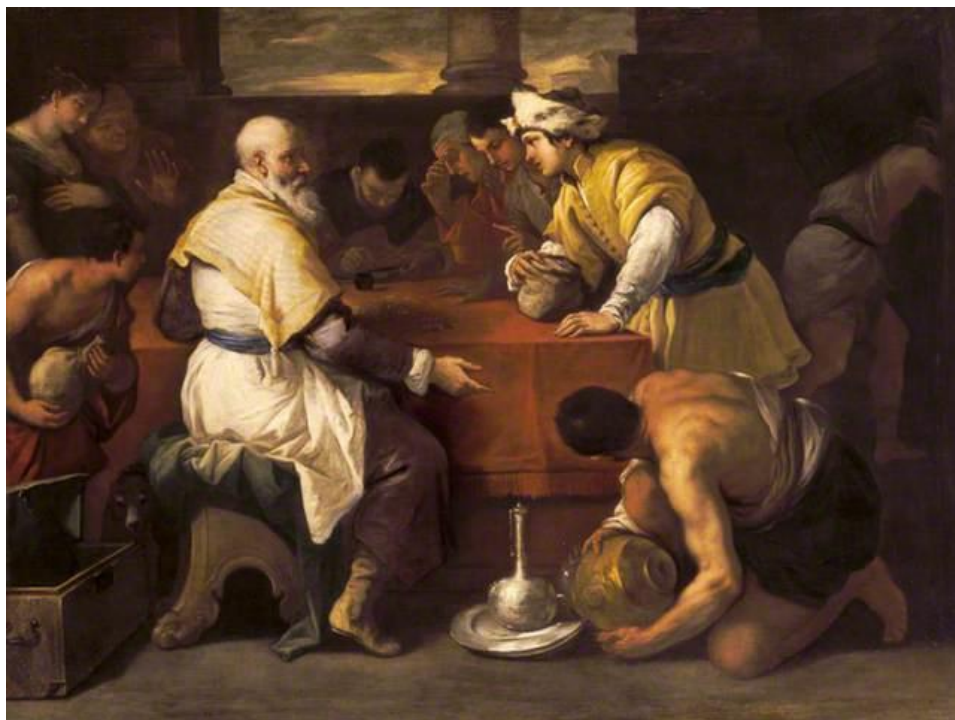
L. Giordano: Podobenstvo o márnoratnom synovi. Po obdržaní svojho podielu (17.st.)