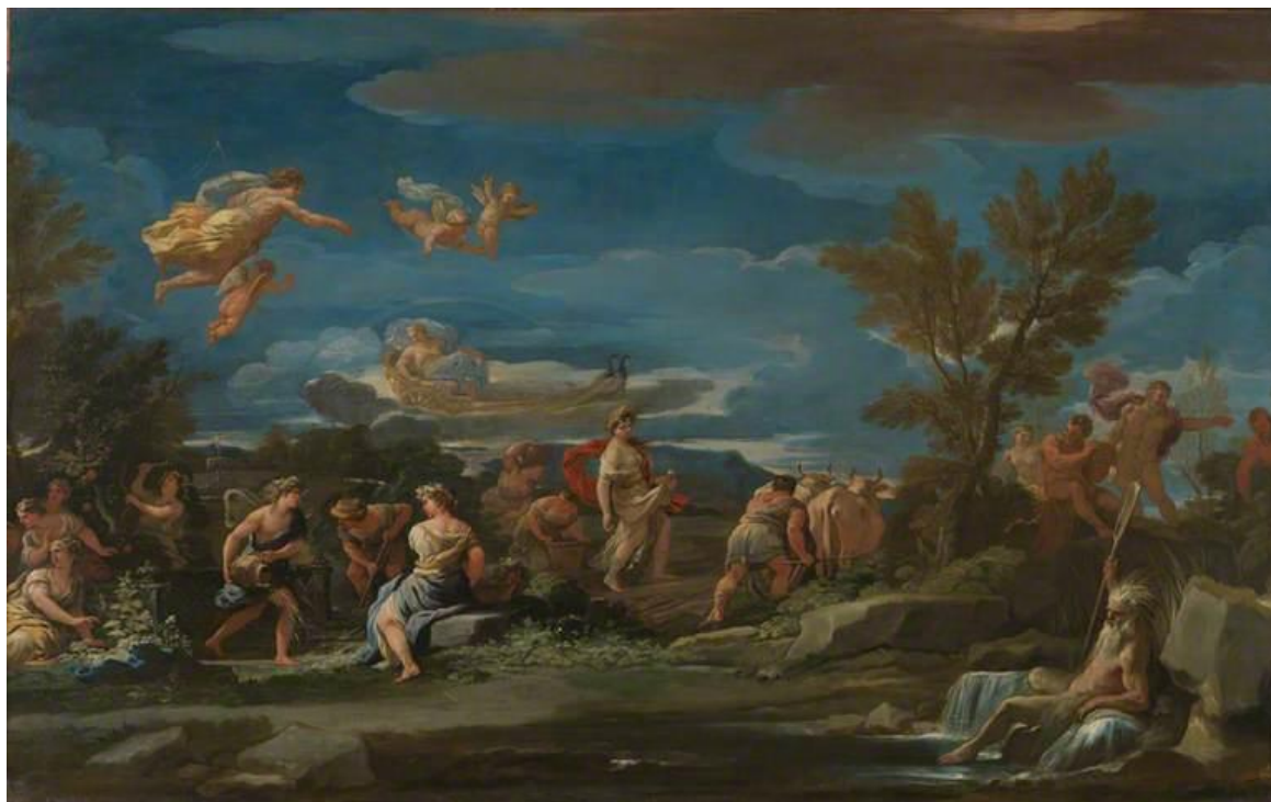
L. Giordano: Mytologická scéna poľnohospodárstva (17.st.)