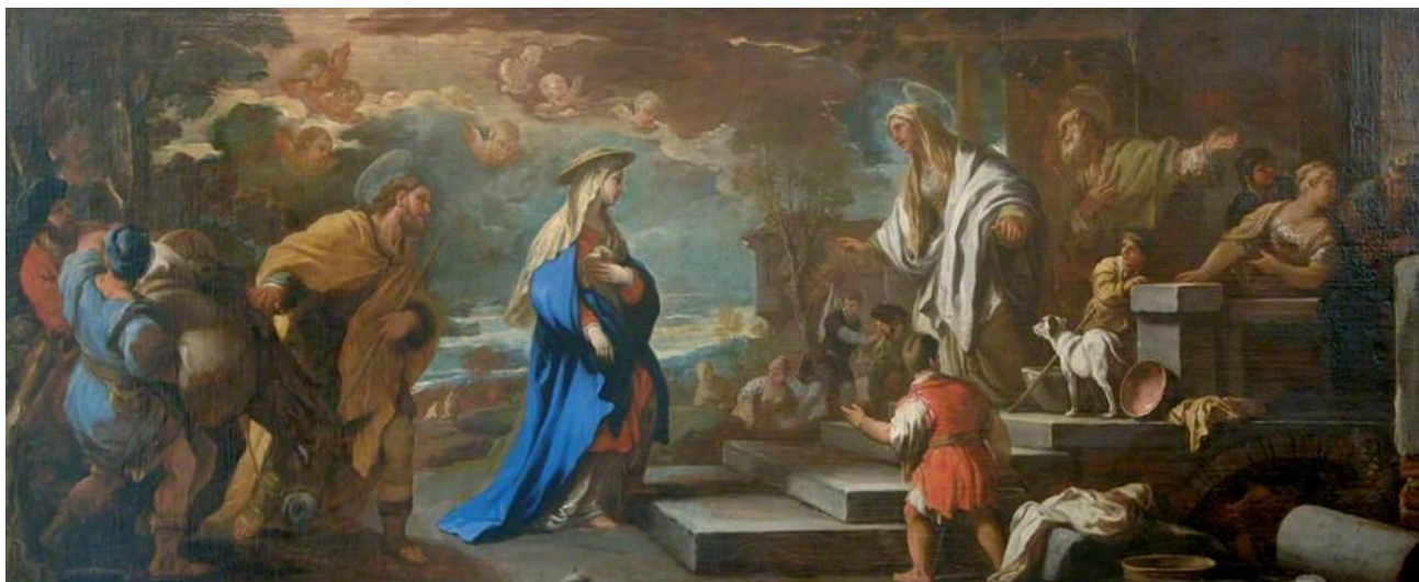
L. Giordano: Navštívenie (17.st.)