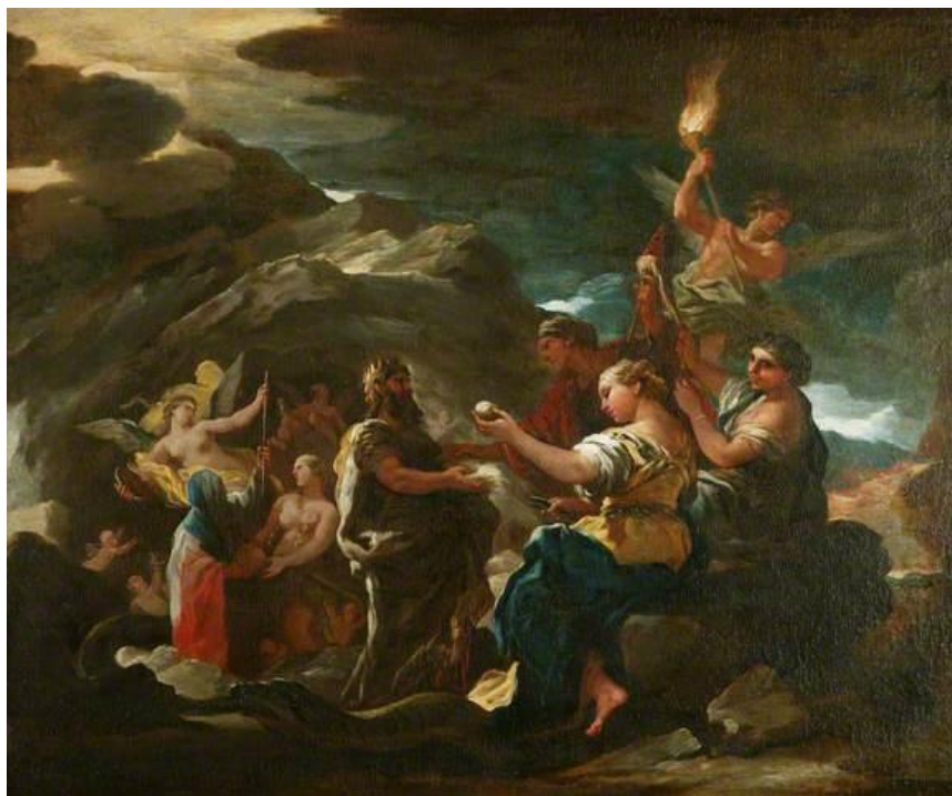
L. Giordano: Jaskyňa večnosti (17.st.)