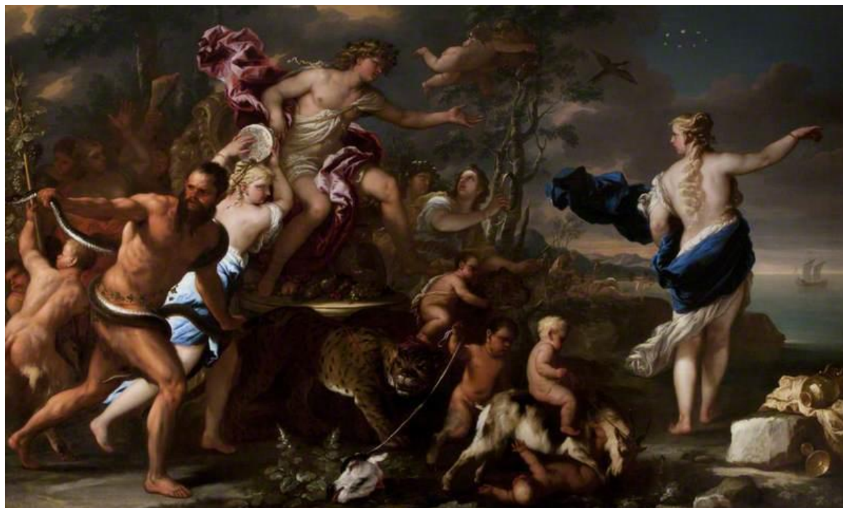
L. Giordano: Triumf Bakcha a Ariadny (17.st.)