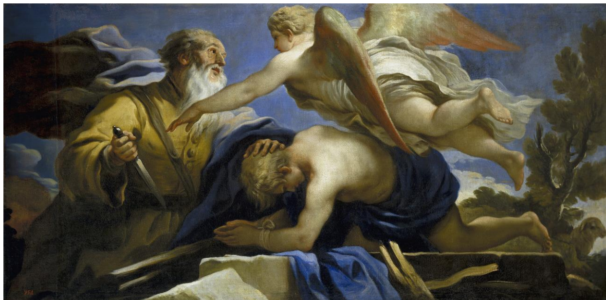
L. Giordano: Obetovanie Izáka (17.st.)