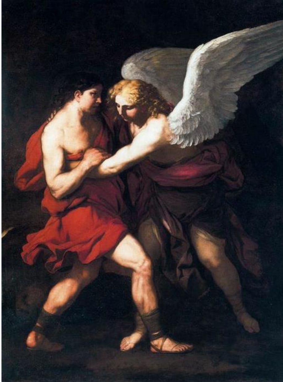
L. Giordano: Jákob bojuje s anjelom (17.st.)