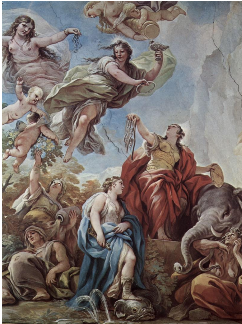
L. Giordano: Temperancia (freska v Galérii Palazzo Medici-Riccardi, Florencia, 1684-1686)