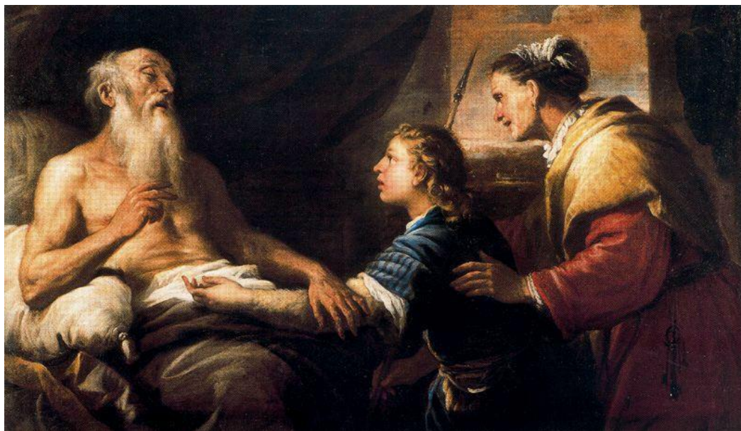
L. Giordano: Požehnanie Izáka (17.st.)