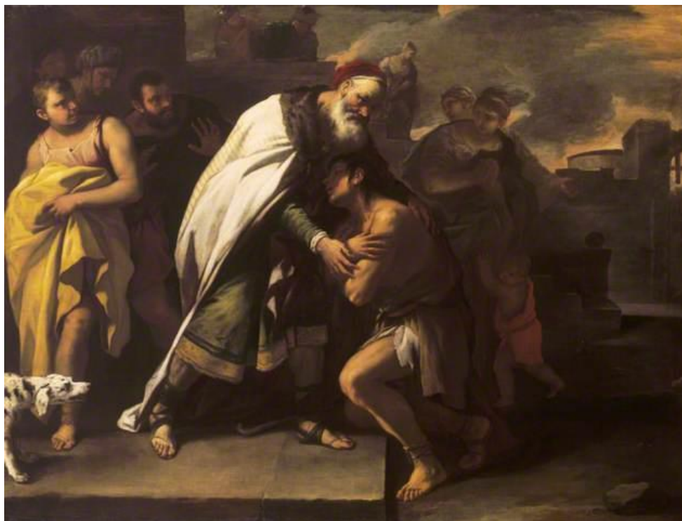
L. Giordano: Podobenstvo o márnotrattnom synovi. Návrat domov k otcovi (17.st.)